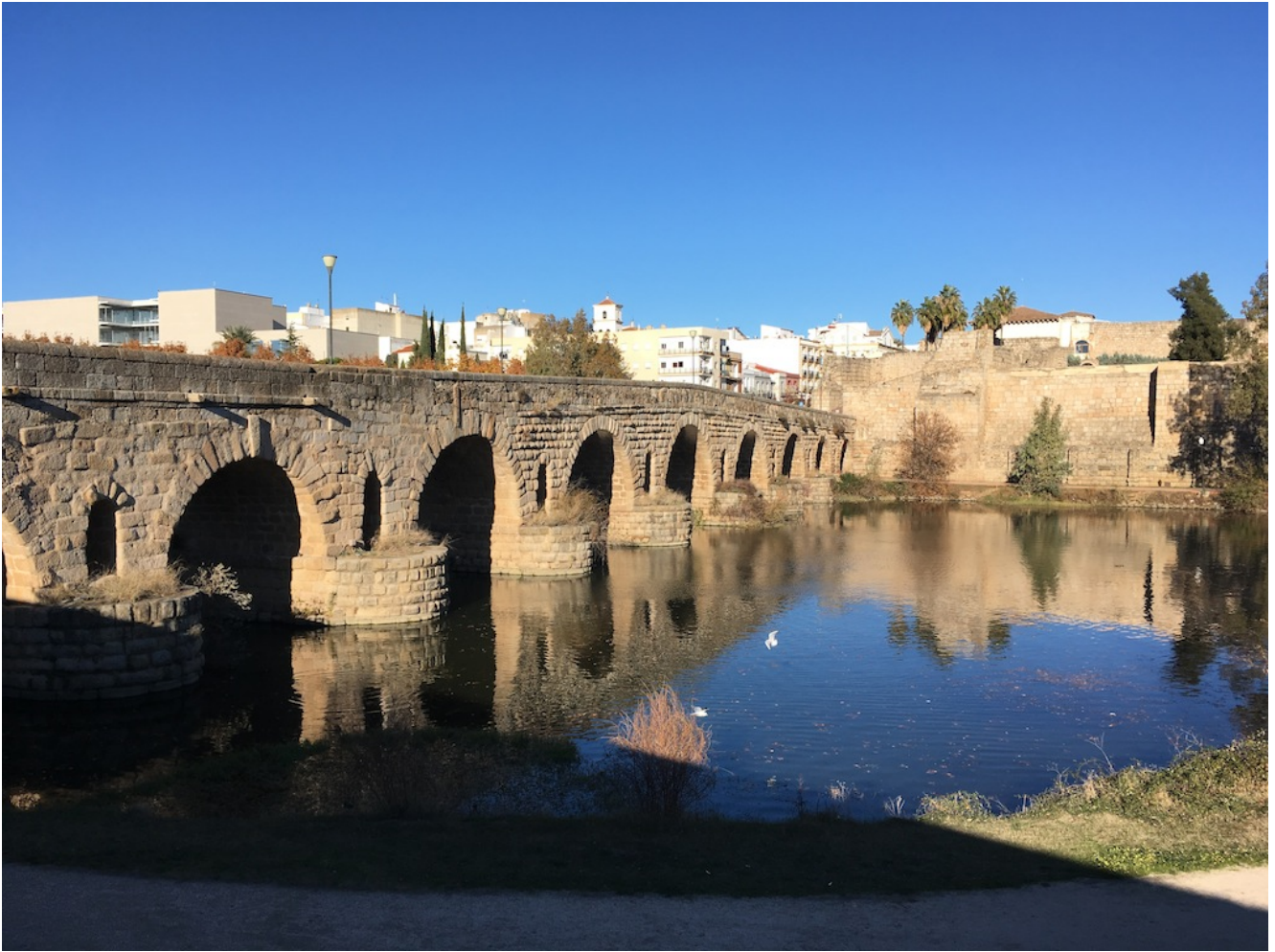
puente romano sobre el Guadiana