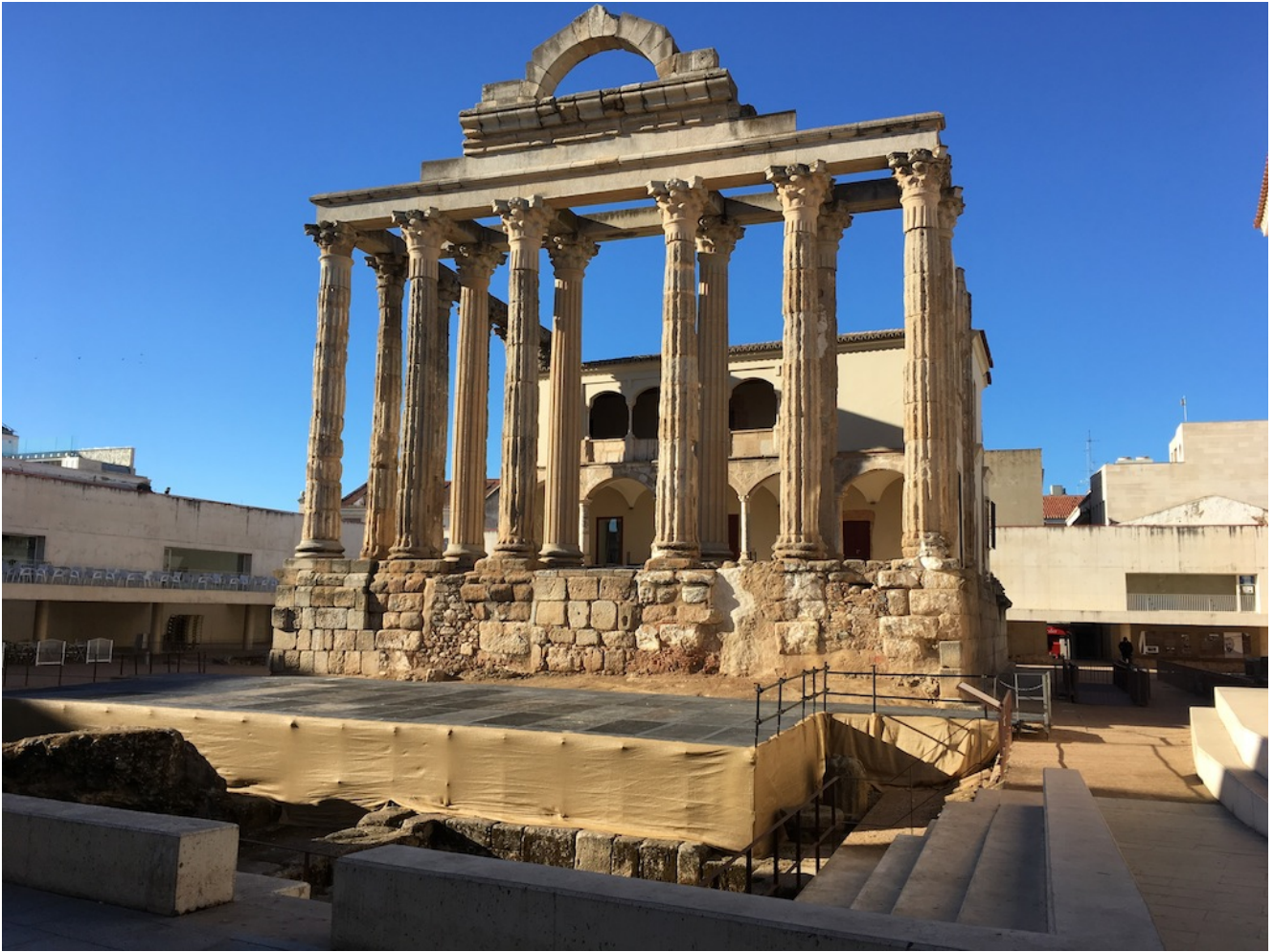
Templo de Diana

Terminaremos nuestro recorrido pasando por la Casa de Mitreo y el Area Funeraria de los Columbiarios , la Cripta Arqueológica de Santa Eulalia , el Area Arqueológica de la Moreria , el Circo Romano , el Arco de Trajano y el Puente Romano sobre el Guadiana para a las 19 horas tomar el bus de vuelta a casa.