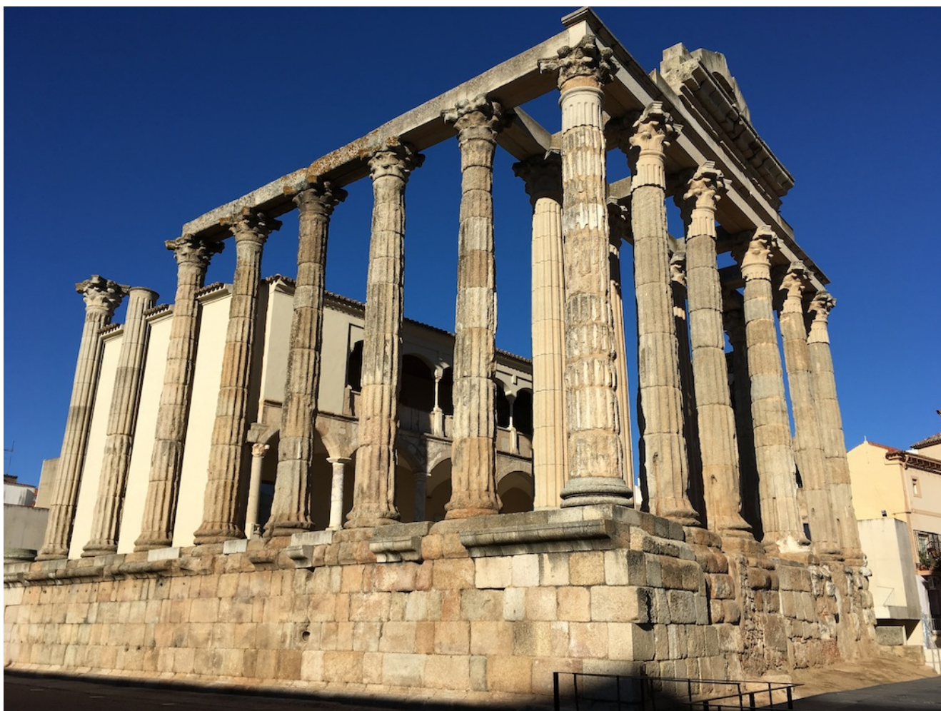
Templo de Diana

recorreremos y conoceremos en esta jornada: la presa de Proserpina, los acueductos, el Teatro y el Anfiteatro, la Casa de Mitreo y el Area Funeraria de las Columbarios, el Arco de Trajano, el Templo de Diana, el Puente sobre el Guadiana, la Cripta Arqueológica de Santa Eulalia, Area Arqueológica de la Moreria y el Circo Romano . Una experiencia inolvidable.