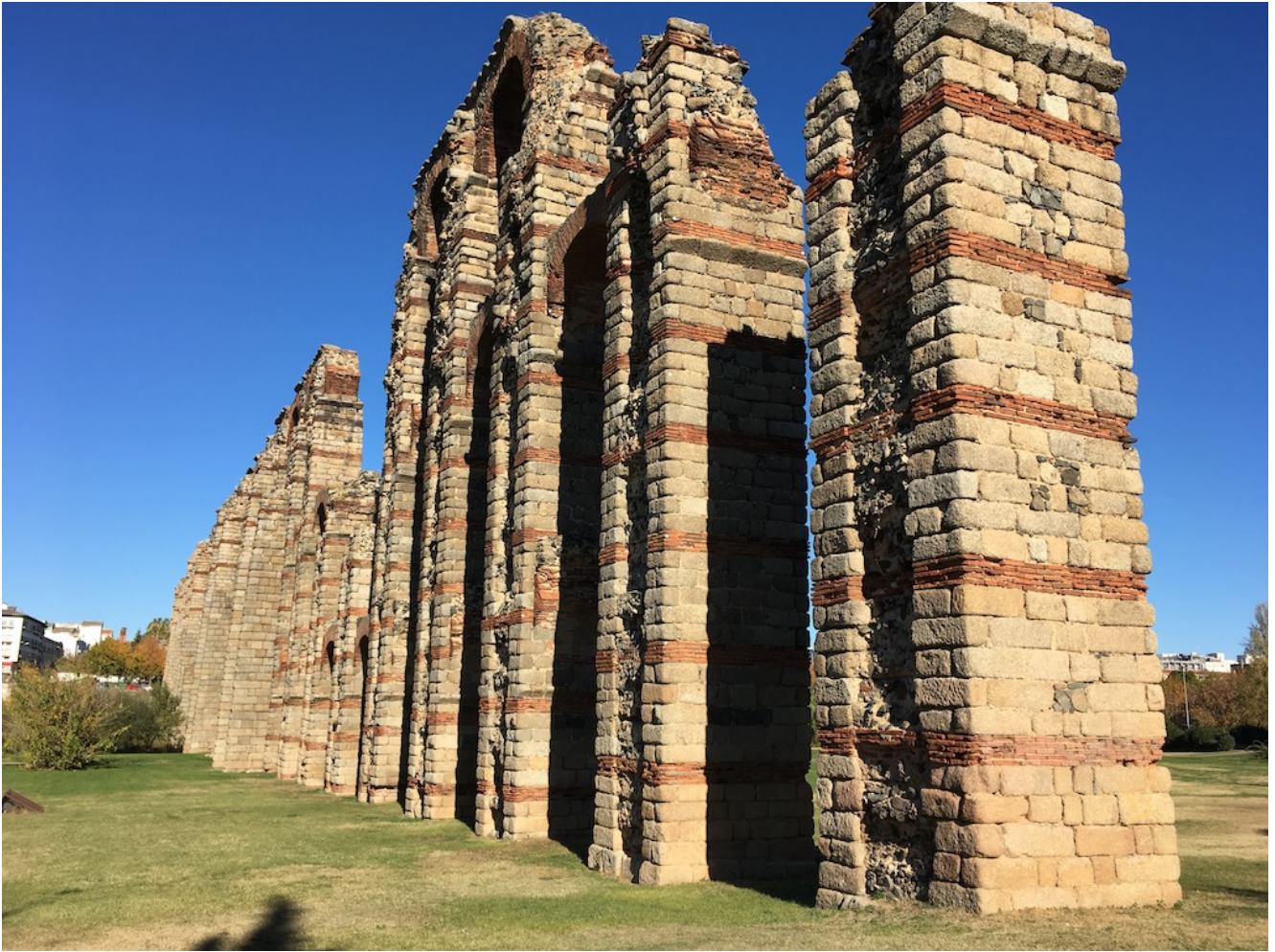
Acueducto de los Milagros

Desde allí nos dirigiremos al centro pasando por el acueducto de San Lázaro y el Hospital Albergue para llegar a las 13 horas al Museo Nacional de Arte Romano de Mérida que visitaremos hasta las 14 horas.