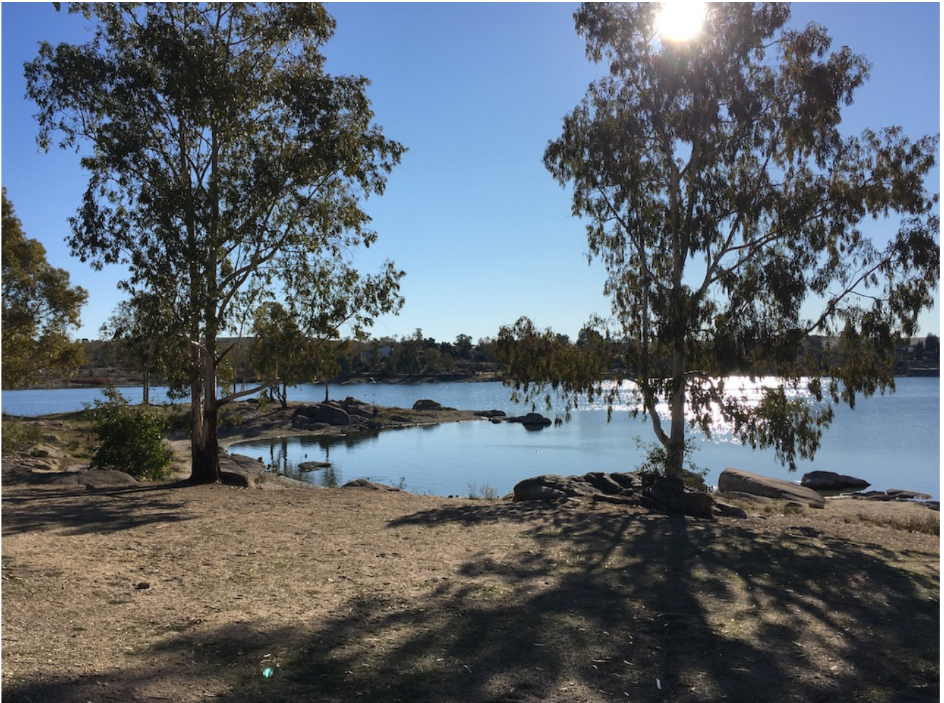
Embalse de Proserpina

Nivel uno x dos- 9 de Febrero. Recorriendo Augusta Emérita son dos rutas de senderismo arqueológico nivel uno que juntas constituye la experiencia de conocer en una jornada de senderismo el pasado romano de Mérida. Por la mañana una ruta de 6 km alrededor del embalse romano de Proserpina y por la tarde una ruta de 8 km por la ciudad conociendo los monumentos emblemáticos con una exquisita comida. Para toda esta experiencia hemos confeccionado un paquete en el que se incluye el bus desde Sevilla.