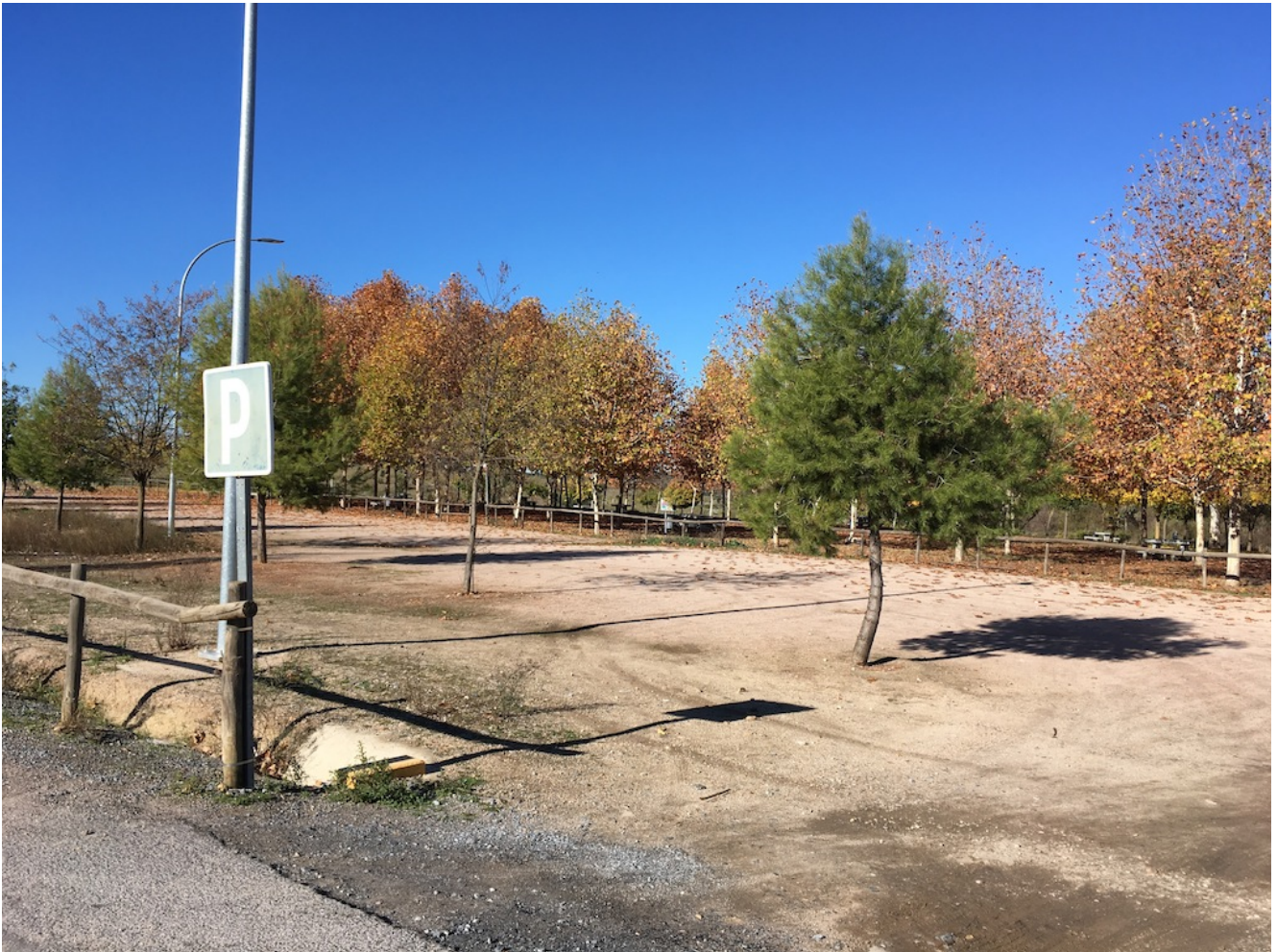
Punto de encuentro

abastecía de agua a la colonia de Augusta Emérita y que data del siglo I Fue declarado Patrimonio Mundial por la Unesco y es una joya que podremos conocer en todo su esplendor.