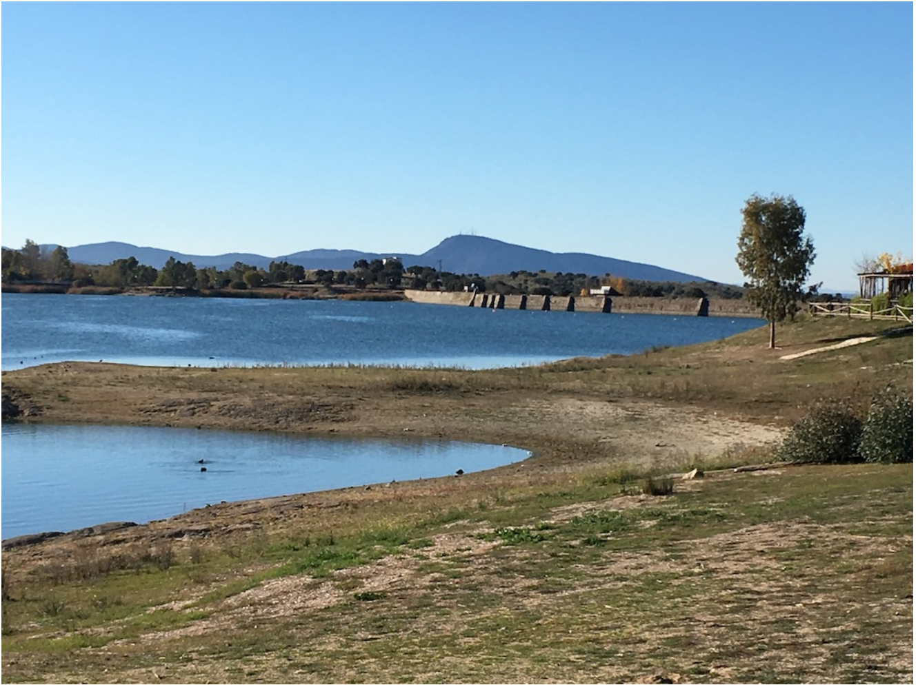
Presa de Proserpina