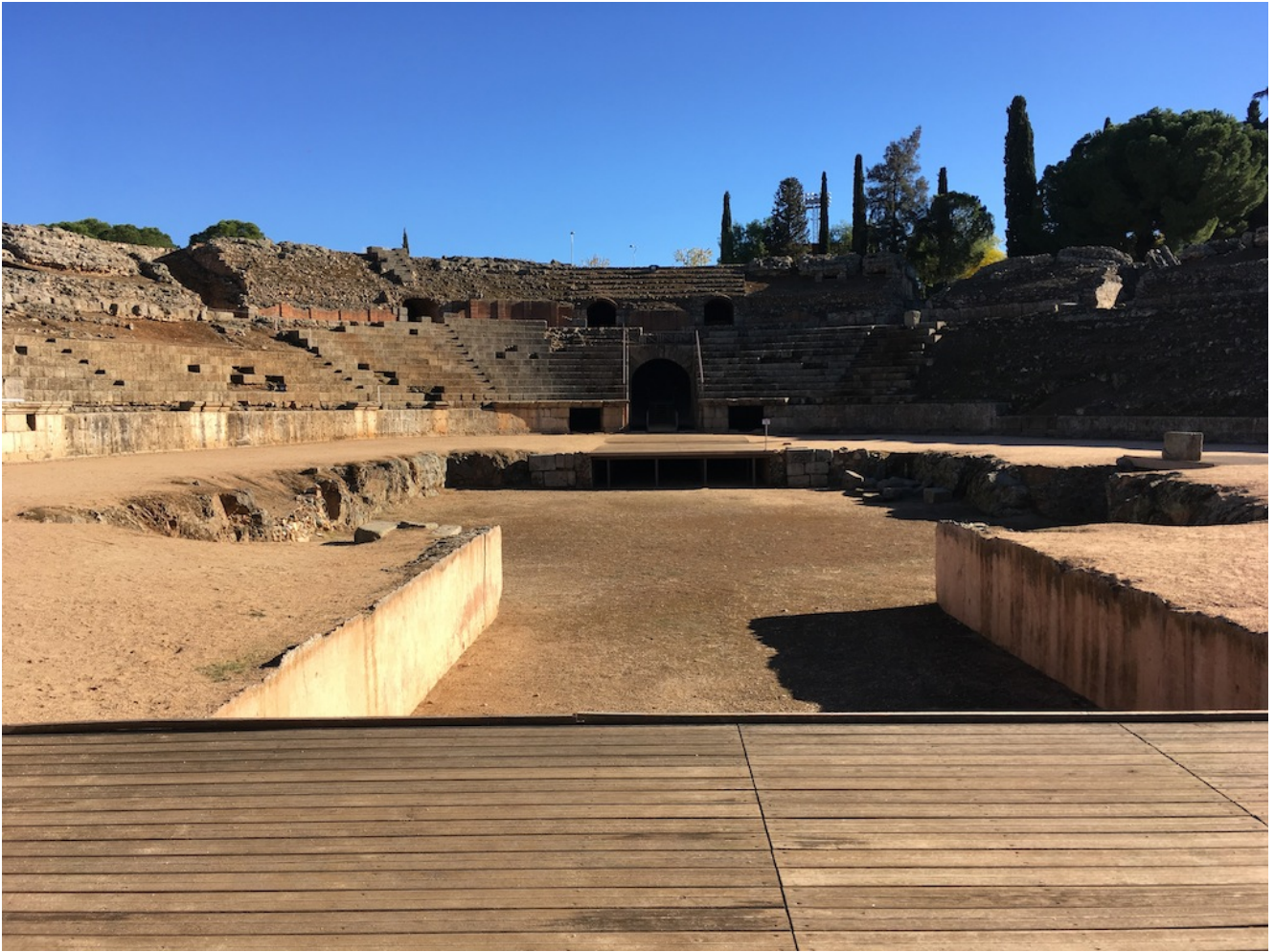
Anfiteatro de Mérida