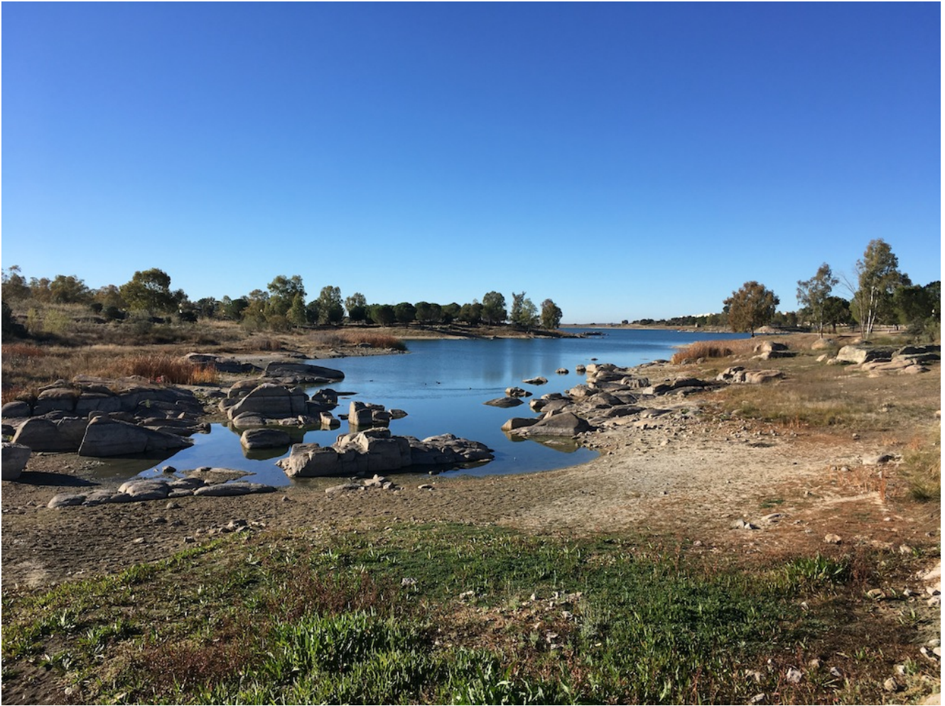
Detalle del embalse

Una vez finalizado el recorrido iremos al autobús y los coches para dirigirnos a la zona del Acueducto de los Milagros donde comenzará nuestra travesía de 8 km por la localidad de Mérida en una visita guiada e interpretada que hará las delicias de todos vosotros.