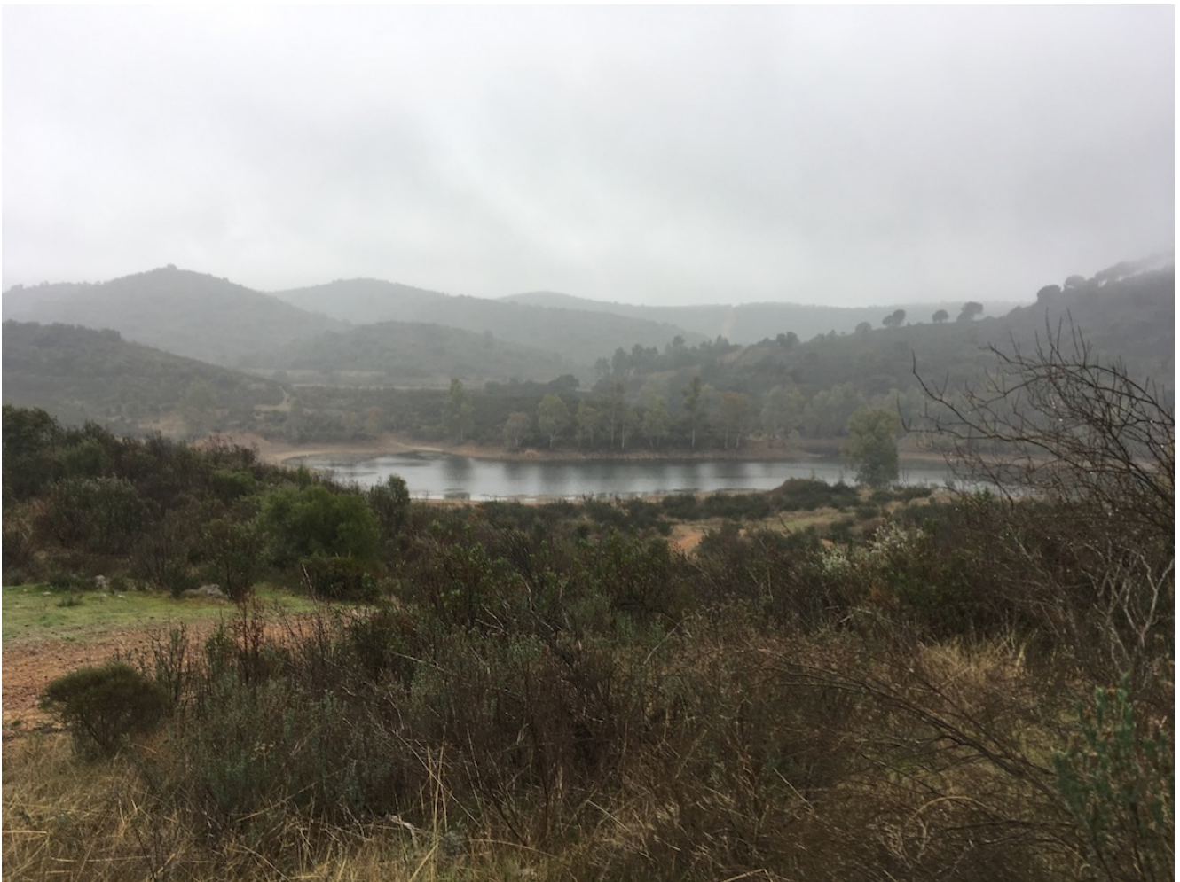
Pantano Castillo de la Guardas

Nivel uno- 29 de abril. Vamos a realizar una excursión de Senderismo en la Reserva del Castillo de las Guardas que une un recorrido por la zona con la visita al safari parque. Es una ruta de senderismo muy sencillita de nivel uno con 5 km y 150 metros de desnivel acumulado en subida. Nos desplazaremos a la zona en autobús de línea.