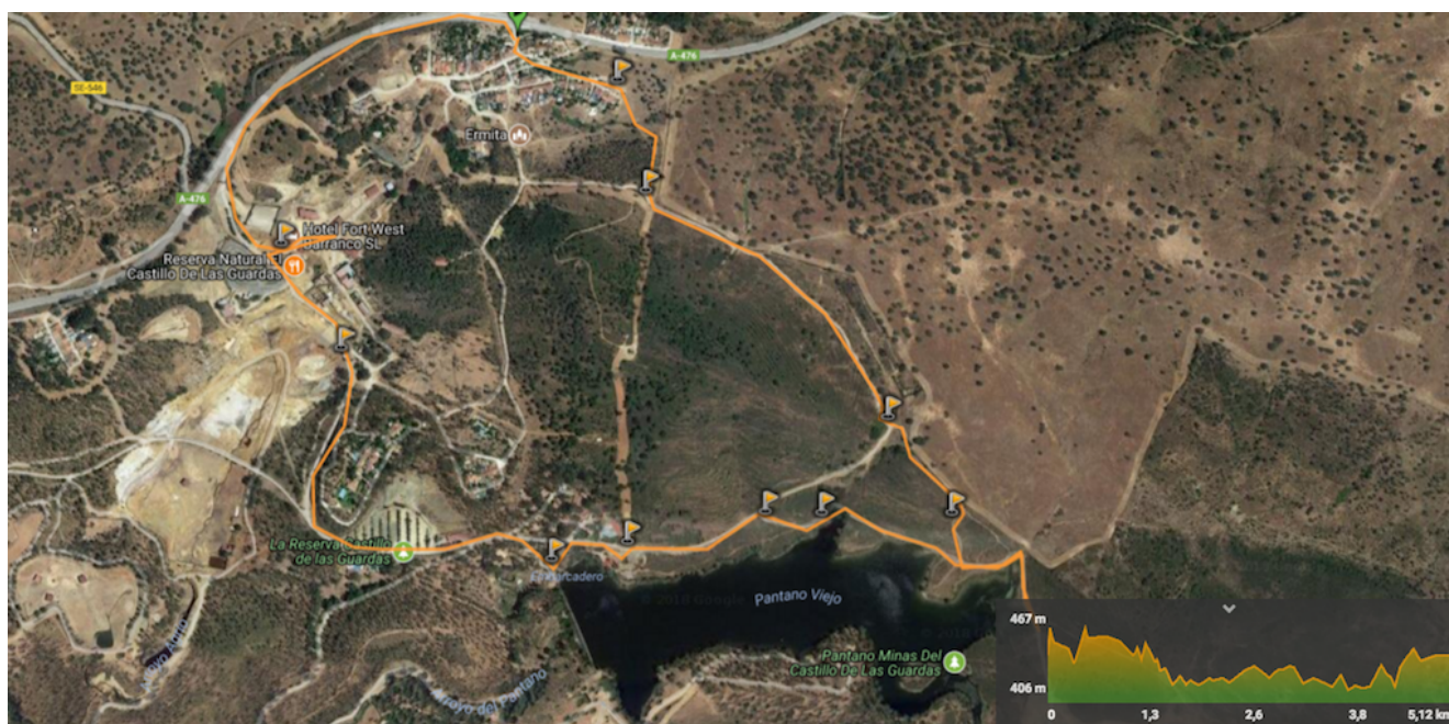
Track de la ruta