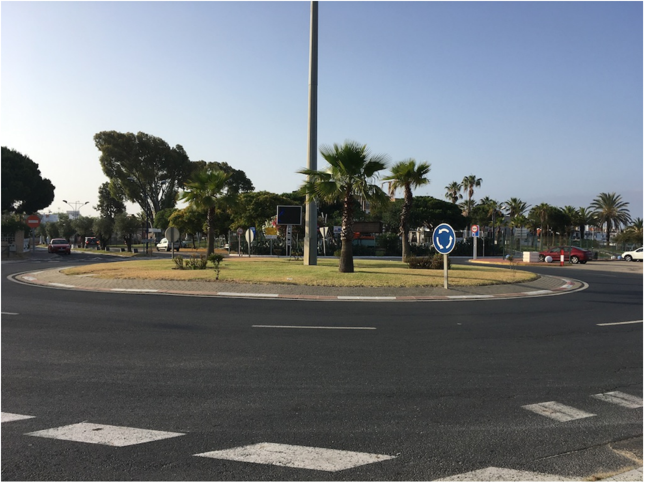
Rotonda entrada Matalascañas

El Parque Dunar está ubicado en el término municipal de Almonte, al que pertenece Matalascañas es un laberinto de caminos señalados de arena jalonado de pinos piñoneros y con el mar como fondo, produciendo una agradable sensación ya que su brisa nos envuelve en todo momento y nos protege del calor.