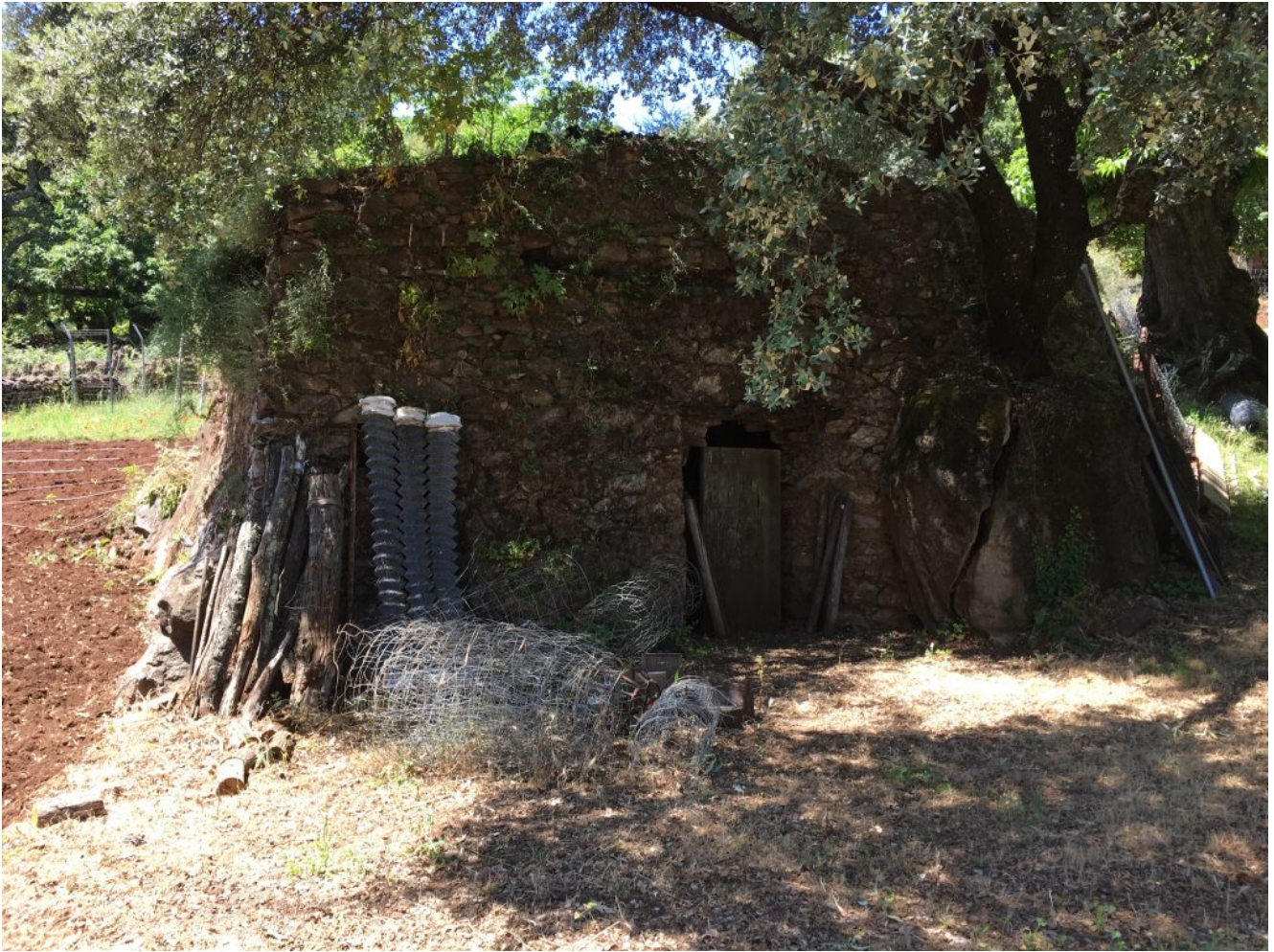
Horno de Cosme