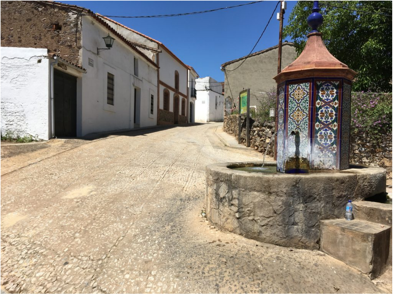
Fuente de los Tes Caños

Desde la fuente empezamos la excursión por el Sendero Risco de Levante , un sendero con paredes de piedra que atraviesa la aldea de La Presa y está jalonado por parajes frescos y húmedos domesticados por huertas y molinos, y con la ayuda de varios puentes y pasarelas de madera culminaremos el recorrido en el singular paraje del Risco del Levante que da nombre a nuestro camino. Como las imágenes de este sendero son de extrema belleza hemos preferido crear una galería con las mejores imágenes del camino que hemos elegido.