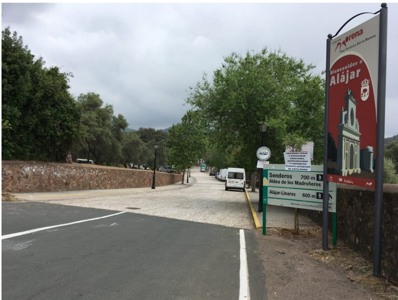
Parking de Alajar

coordenadas GPS son 37.87416210405239, -6.669405120492575 y cuya imagen podemos ver debajo de estas líneas. Para los que van en bus recogemos a las 8.00 horas Gran Plaza, 8.15 horas Avenida José Laguillo y 8.30 horas Cervecería Ronda el Alamillo. Paramos a desayunar y volvemos a las 18 horas.