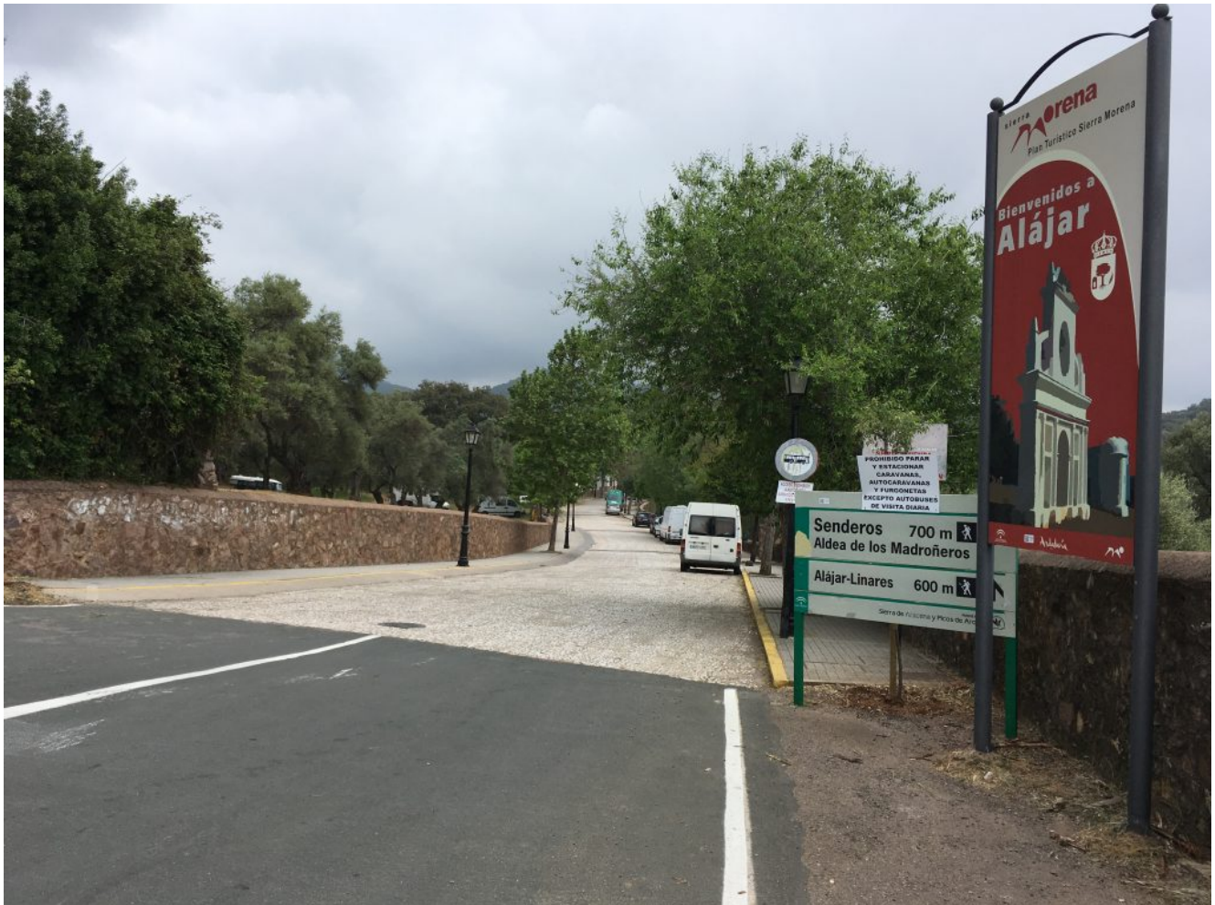
Parking de Alajar

coordenadas GPS son 37.87416210405239, -6.669405120492575 y cuya imagen podemos ver debajo de estas líneas. Para los que van en bus recogemos a las 8.00 horas Gran Plaza, 8.15 horas Avenida José Laguillo y 8.30 horas Cervecería Ronda el Alamillo. Paramos a desayunar y volvemos a las 18 horas.