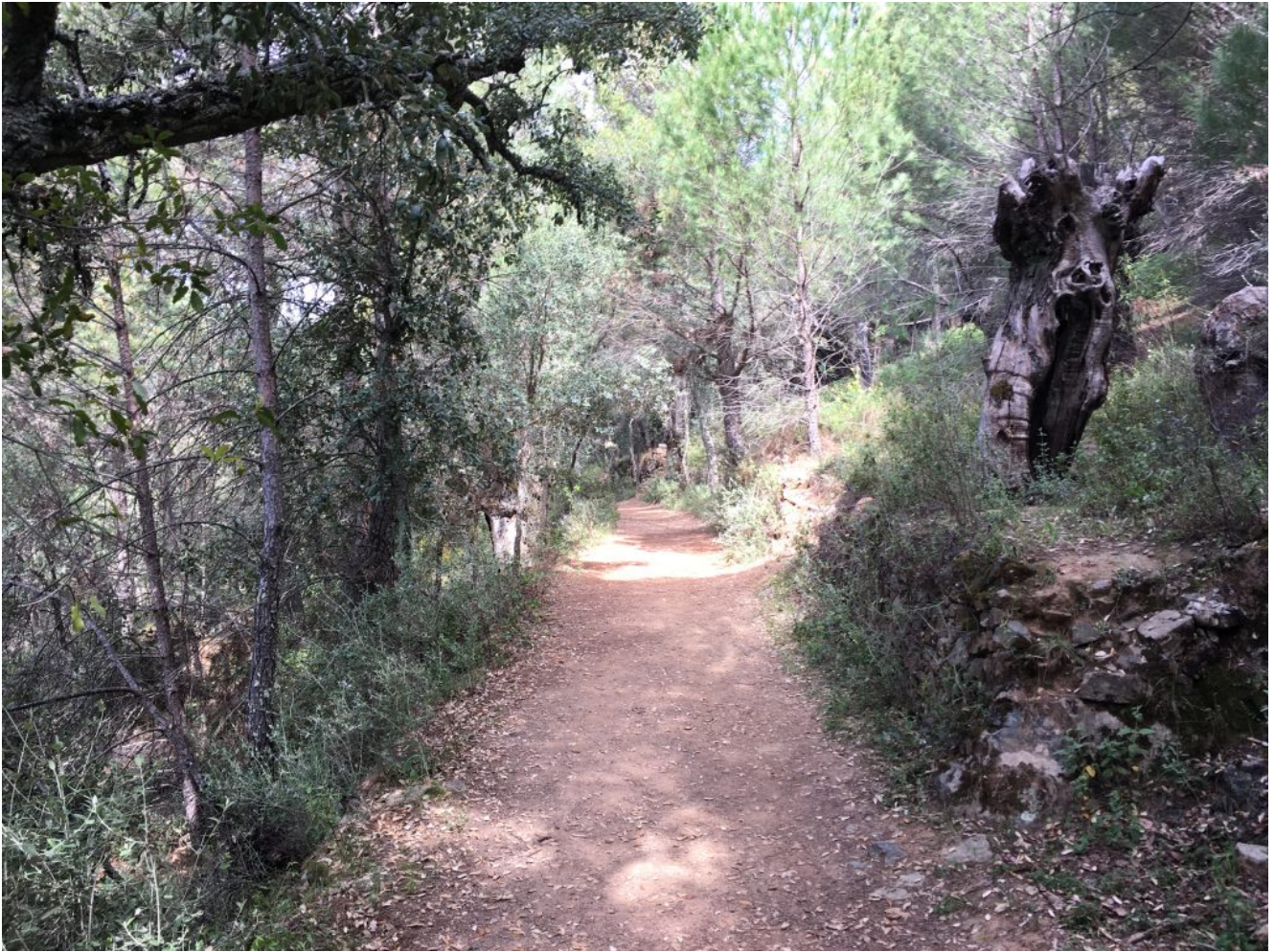
Subida al mirador