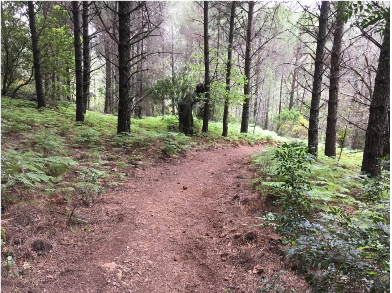
Camino entre helechos