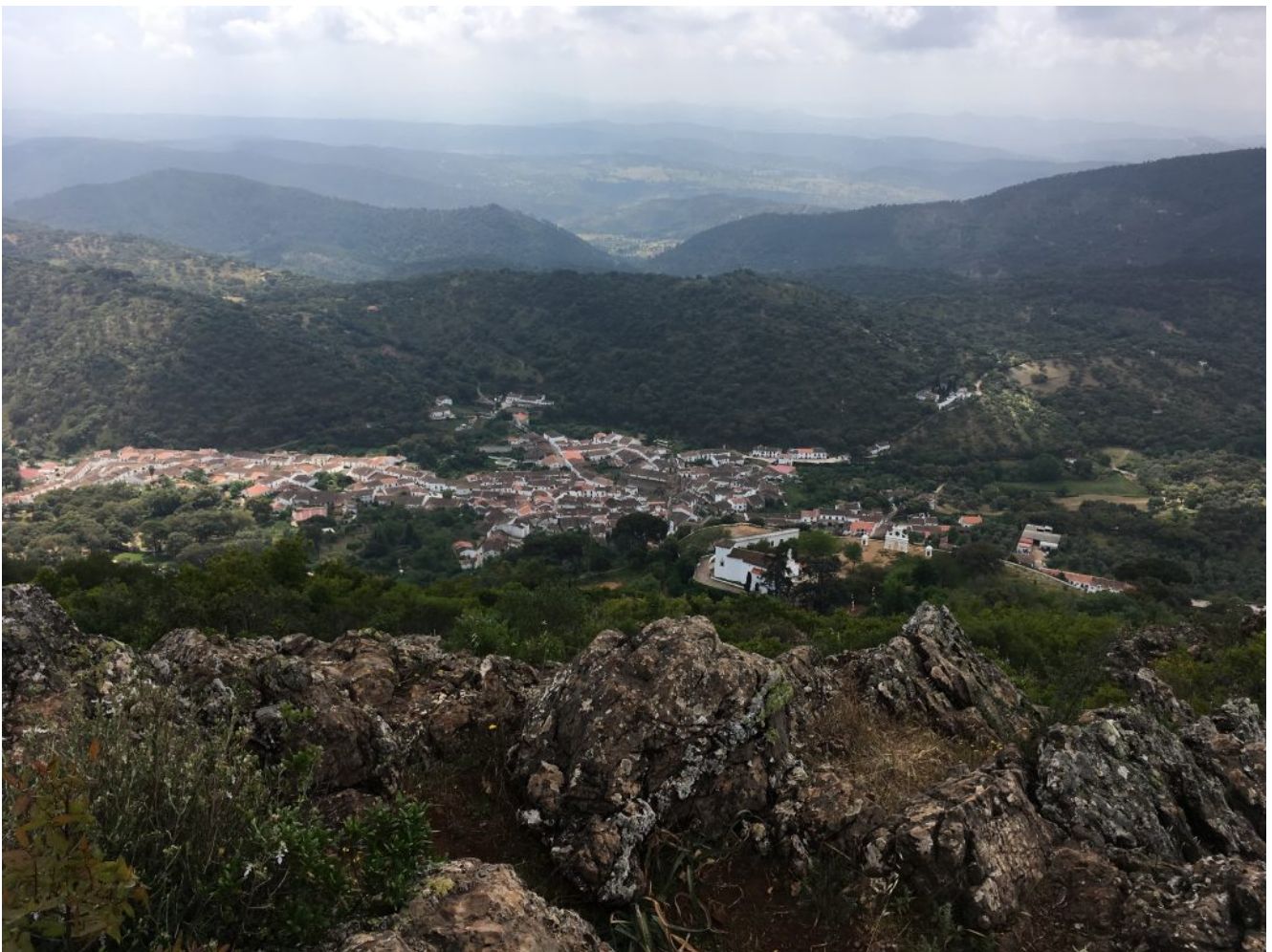
Imagen de Alajar

Nivel dos- Martes 28 de febrero de 2023. Vamos a realizar el Día de Andalucía la Ruta Circular en Alajar , que nos va a llevar a tierras de Huelva, concretamente a la Sierra de Aracena, para hacer una preciosa excursión que parte de Alajar , subiendo a Peña Montano , luego al Mirador de la Sierra de la Peña , desde allí dirección a Castaño del Robledo para llegar por el Calabacino otra vez a Alajar. Son 10 km y 320 metros de desnivel acumulado. Pondremos transporte desde Sevilla y se puede venir en coches particulares.