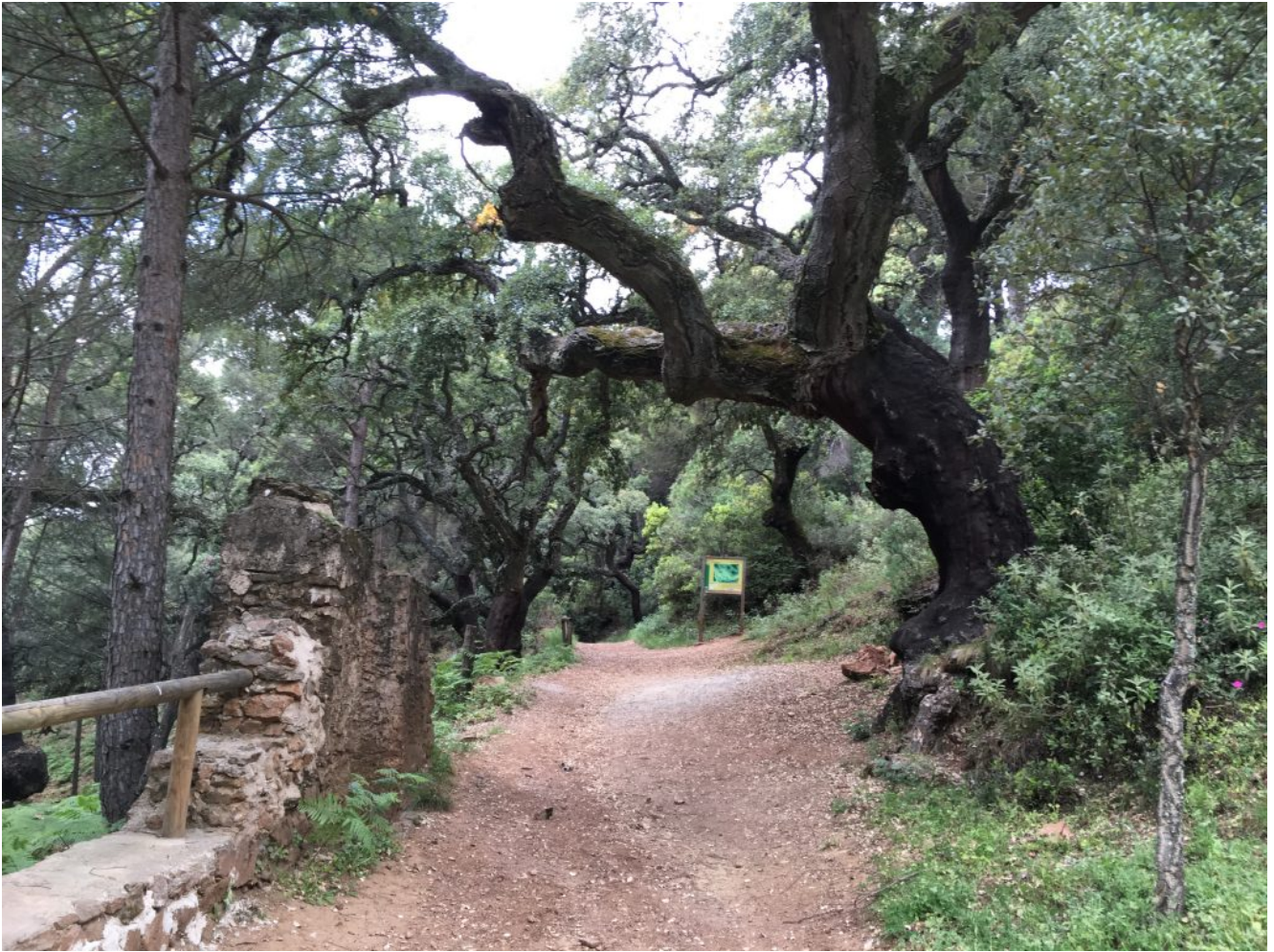
Iniciamos la subida al Mirador