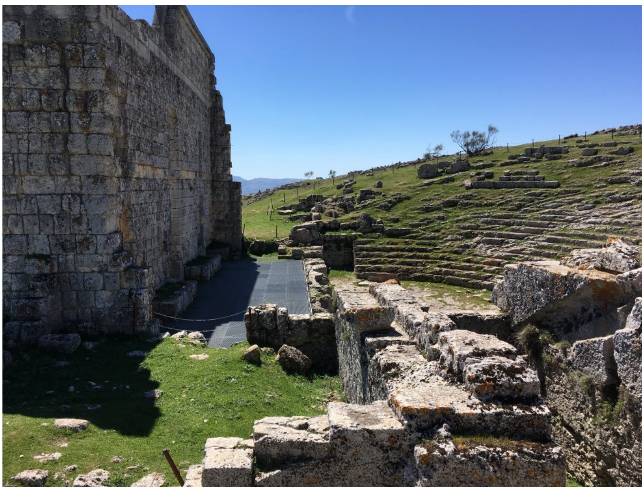
Teatro romano de Acinipo

como lugar de ocupación en la Prehistoria. En ella destaca su teatro, uno de los mejores conservados de la Hispania romana. Son visibles algunos elementos de la ciudad, como una domus o vivienda señorial romana y unas termas, dotadas de su palestra para ejercicios gimnásticos. De las etapas prerromanas de la ciudad, se conservan unas cabañas de la Edad del Hierro. La impresionante situación de Acinipo, a casi 1000 m. de altitud lo convierten en un hito de gran importancia, desde el que se contemplan paisajes de las provincias de Málaga, Cádiz y Sevilla.