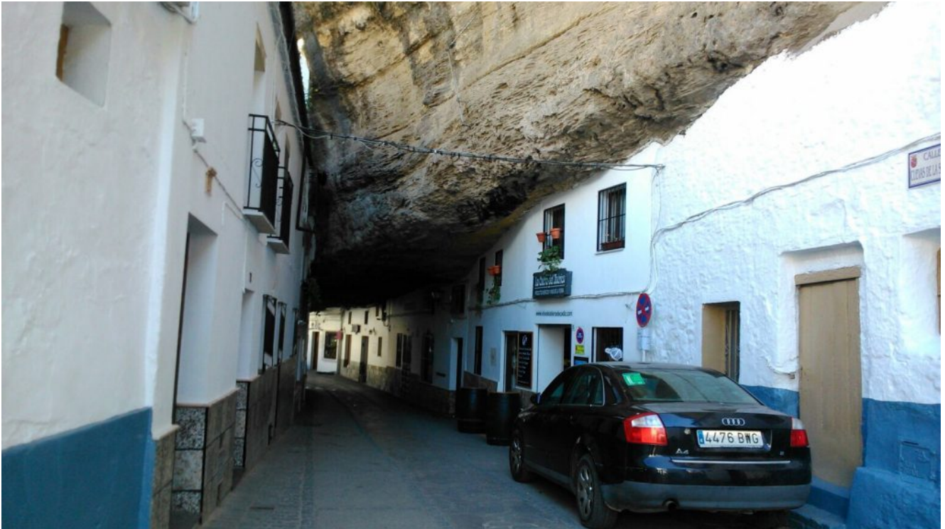
Calle de Setenil

entramado urbano convierten a Setenil en uno de los principales destinos turísticos de la Sierra de Cádiz.