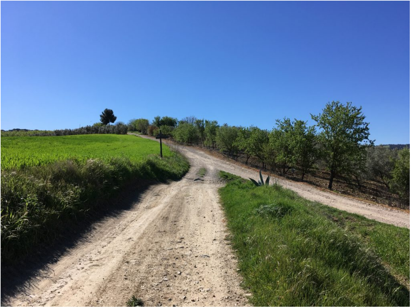
Empieza la subida a Acinipo