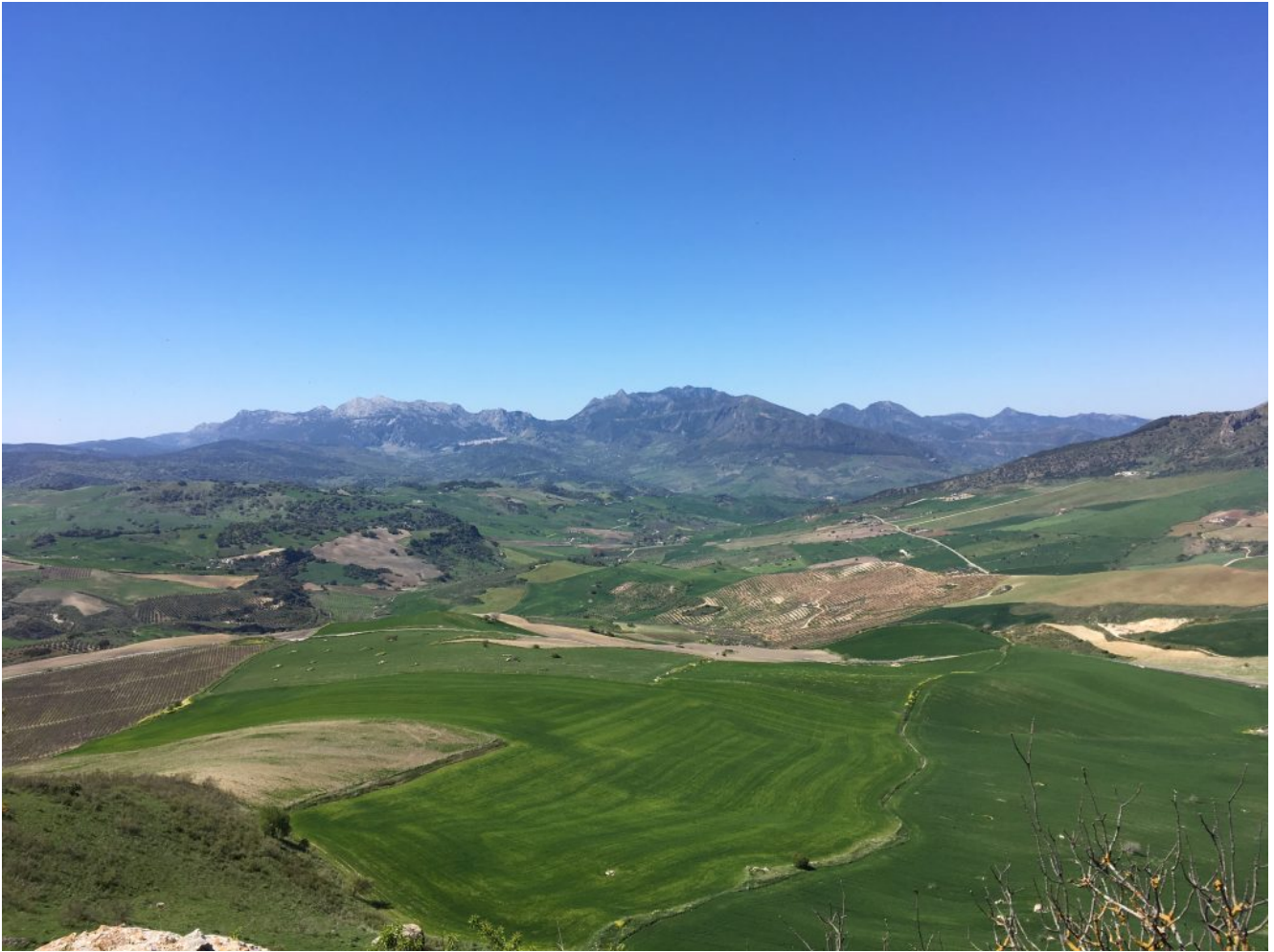
Vista de la Sierra de Grazalema

Una vez en Setenil iremos a conocer esta preciosa localidad y después tendremos un par de horas libre para comer. Por lo que la vuelta a Sevilla será a las 16 horas de la tarde.