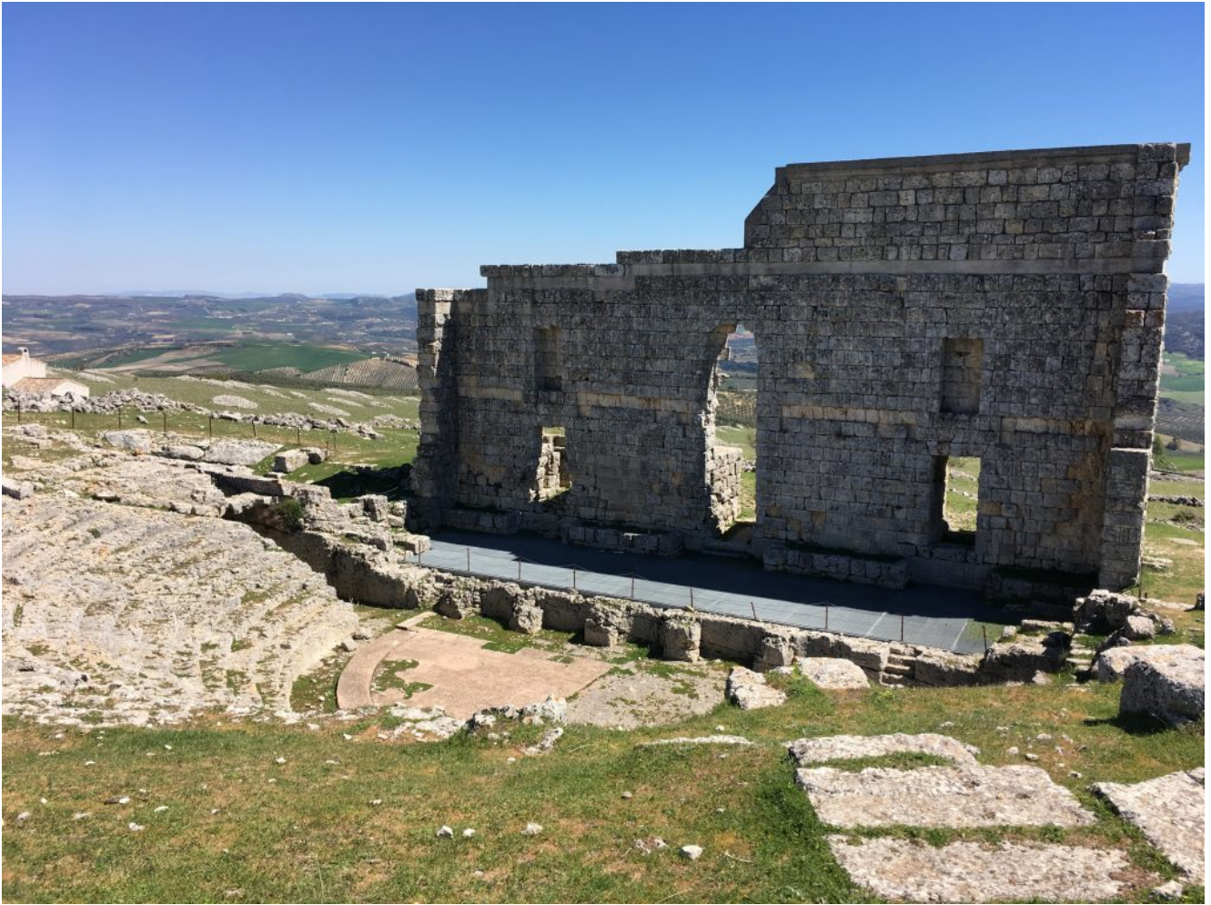
Teatro romano de Acinipo