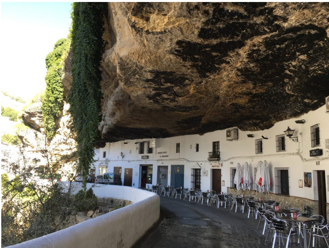
Setenil de las Bodegas

Nivel uno- El sábado 18 de febrero 2023 vamos a realizar una excursión de que va desde las ruinas romanas de Acinipo hasta Setenil de las Bodegas por la ruta de los bandoleros. Es una excursión fácil ya que se hace cuesta abajo y son 10,5 km y 100 metros de desnivel acumulado. Es obligatorio hacerla en bus ya que es lineal de sólo ida.