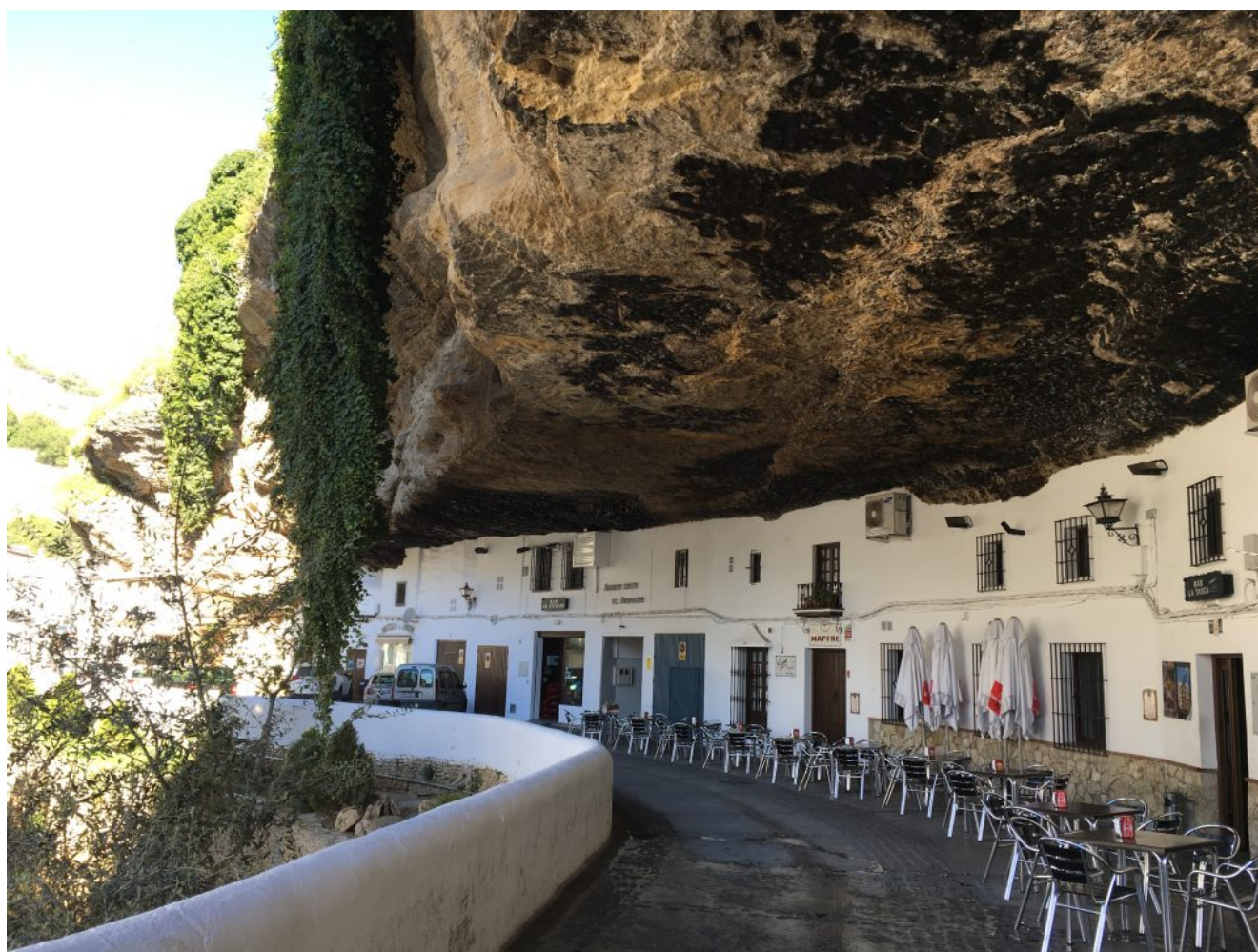
Setenil de las Bodegas