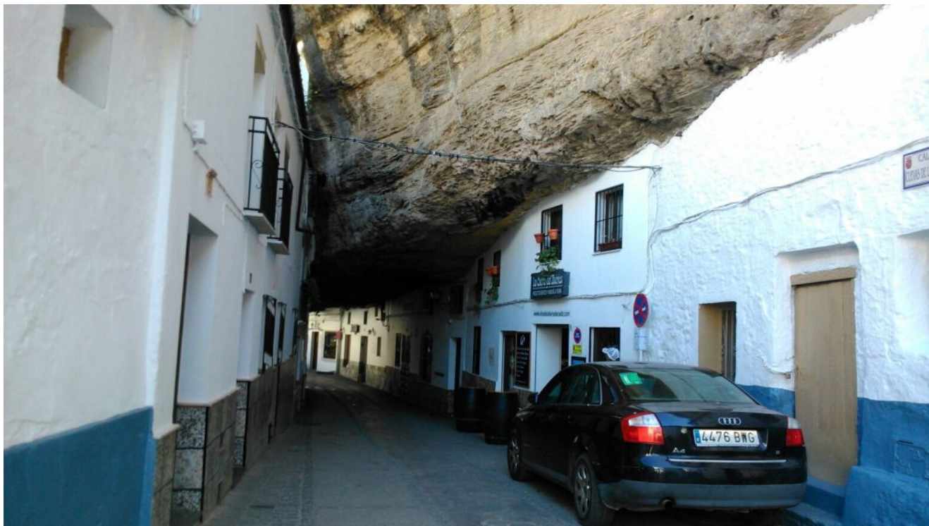
Calle de Setenil

incrustado en el tajo formado por el río Guadalporcún a su paso por la ciudad. La singularidad y extrema belleza de su entramado urbano convierten a Setenil en uno de los principales destinos turísticos de la Sierra de Cádiz .