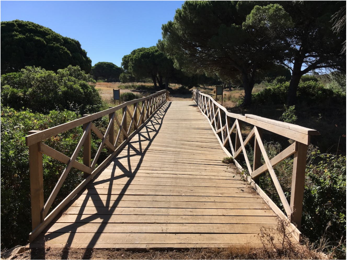
Puente en la Pinada del Río Roche

Allí recorreremos el sendero del mismo nombre, siendo uno de los lugares más húmedos de costa de Cádiz donde se puede encontrar hasta helechos. El río da cobijo a aves de marismas, anguilas, gallipatos y el raro pez salinete (en peligro de extinción)