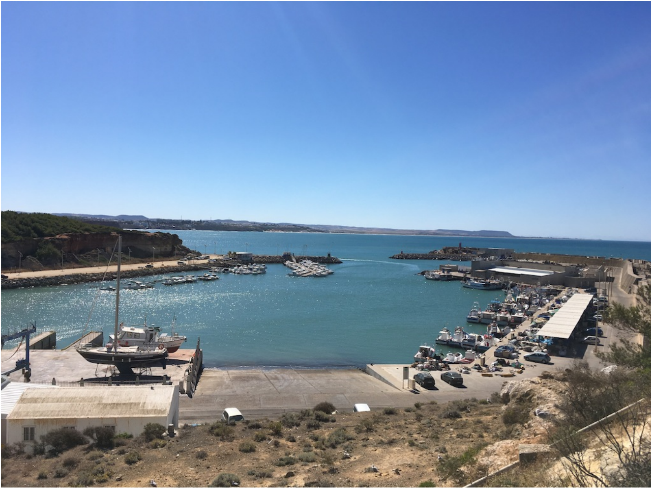
Puerto de Conil

Recorreremos los preciosos acantilados donde se pueden contemplar los restos de antiguos bosques que quedan aislados en el acantilado entre palmitos, romeros y camarinas.