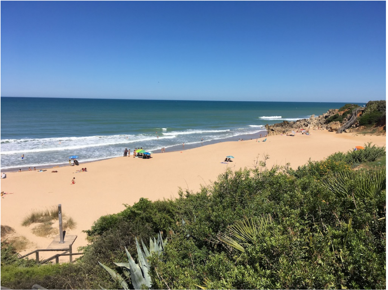
Punta del Frailecillo

También recorreremos las calas de Roche hasta llegar a la punta del frailecillo y de ahí a playa Barrosa hasta Chiclana dejando a nuestra derecha la Torre del Puerco (vestigio de las guerras anglo-hispanas contra Napoleón) y a la izquierda en el mar la isla de Sancti Petri ( fundada por los griegos y donde dice la leyenda que se hallaba la columna de Hércules, lugar que recomendamos como visita posterior a la excursión)