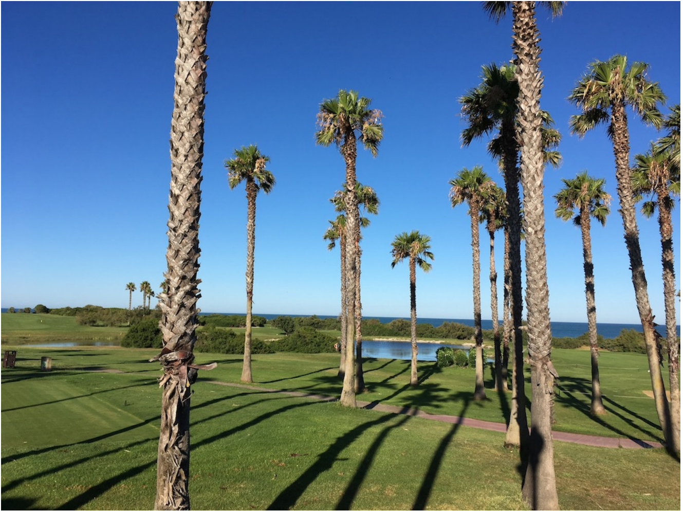
Campo de Golf en La Barrosa