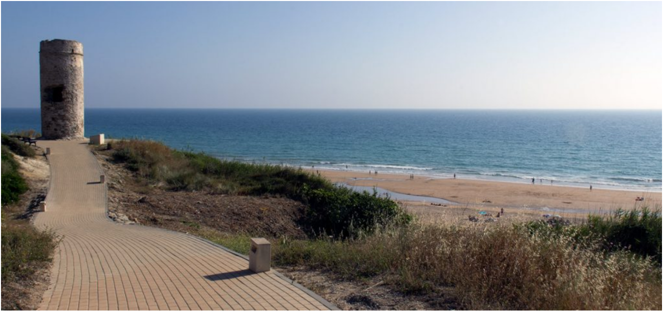
Torre del Puerco

Empezamos nuestro recorrido por la parte de las urbanizaciones de lujo, hoteles y campos de golf que atravesamos a una buena velocidad de crucero para llegar a una buena hora a las pinadas del río Roche.