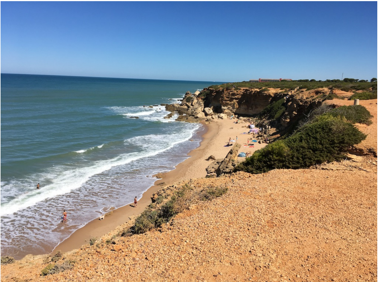
Playa de Roche

Niveles Uno y Dos – El sábado 7 de octubre de 2023 recorreremos la ruta del Cabo de Roche , que es una preciosa circular desde Chiclana a Conil que se puede hacer en dos niveles: el nivel uno, ideal para venir toda la familia, de unos 11 km de recorrido casi llanos y el nivel dos de unos 15 km y 90 metros DAP . Para esta excursión vamos a poner un autobús desde Sevilla y también se podrá llegar en coches particulares.