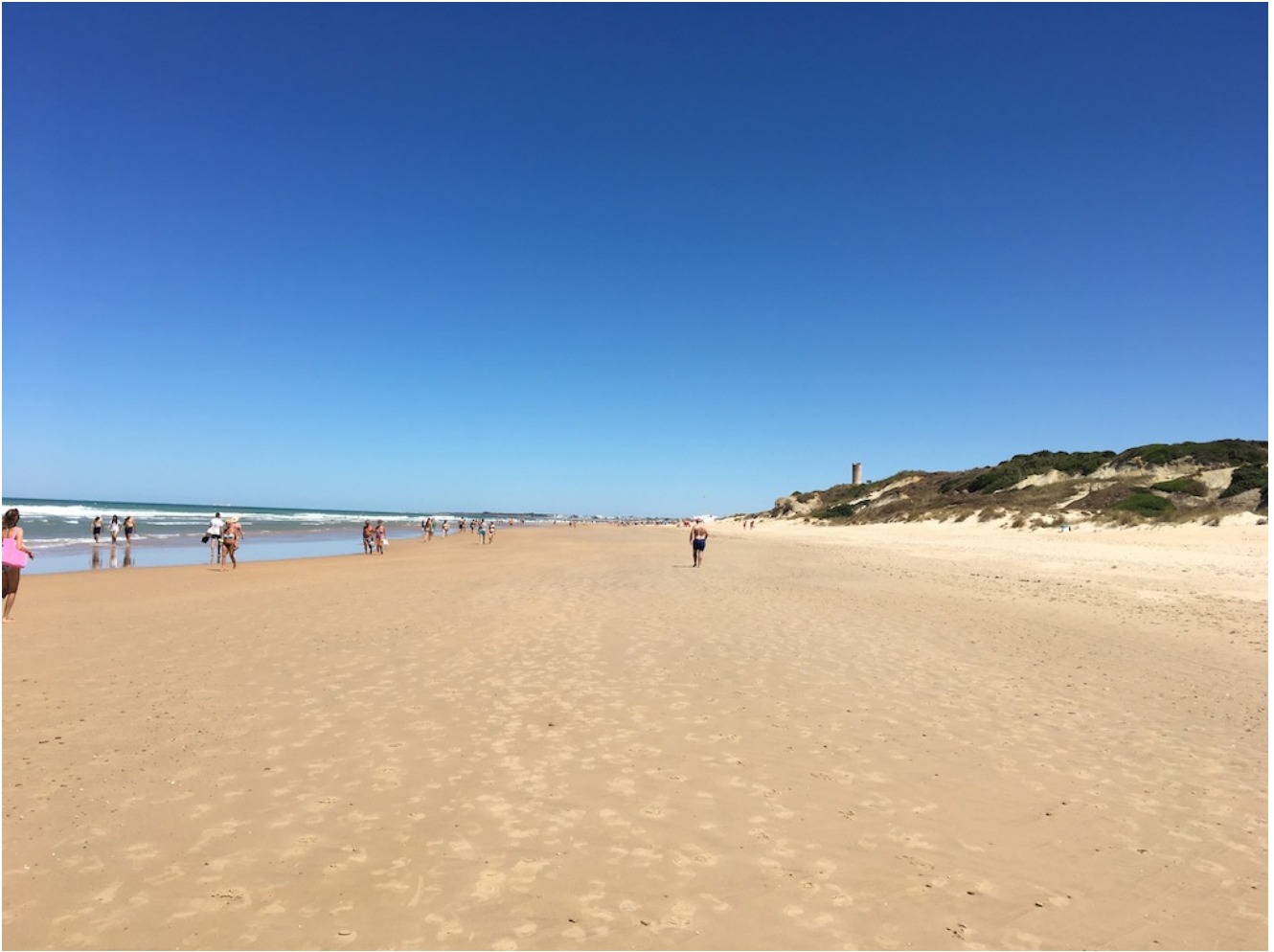
Torre del Puerco

El precio de esta excursión es de 30€ con bus y 18 si vienes en tu coche (10€ menos socios o niños). Si quieres venir con nosotros tienes que realizar el proceso de inscripción para ello puedes hacer el pago con tarjeta o por transferencia en nuestra cuenta de Banco Sabadell ES84 0081 7302 8200 0146 1452 y envíanos el resguardo a nuestro mail (info@senderismosevilla.net) con tu nombre y apellidos, número de DNI, fecha de nacimiento y un móvil de contacto.