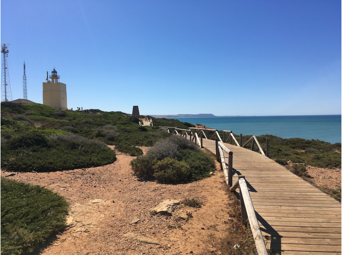
Faro de Roche

conversión en faro en 1986 se ubicaba allí la torre de Roche que formaba parte del sistema de torres de vigilancia costera mandado construir por Felipe II en el siglo XVI para defender las costas españolas de los piratas berberiscos.