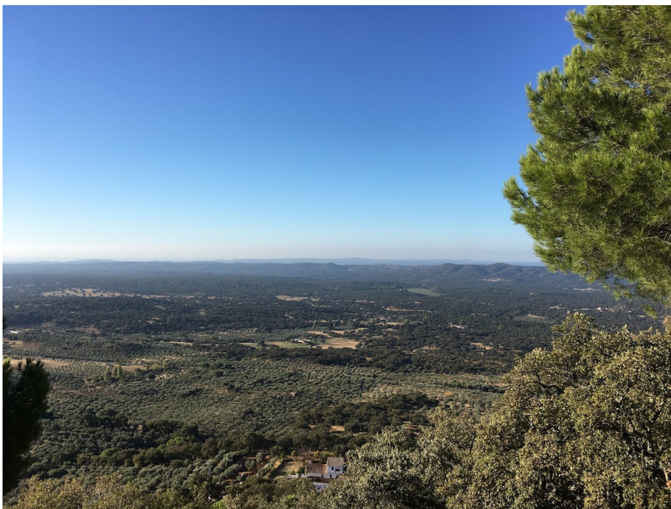
Vista de la llanura

Si vienes con tu perro, hazlo responsablemente y en coche, trae correa y bozal