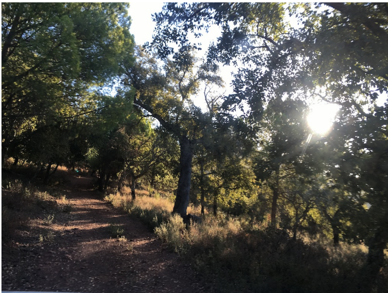
Recorriendo los caminos de El Pedroso

(COMPLETA). Hola senderist@, el sábado 16 de marzo te invitamos a conocer el entorno de un paraje de singular belleza, en nuestro término municipal, a la altura de los grandes yacimientos naturales de la Sierra Morena Sevillana y iicon muchas sorpresas!! Son dos rutas simultáneas de niveles dos bajo de 12 km y 200 metros de desnivel acumulado en subida (incluye niños) y dos alto de 22 km y 500 metros de desnivel acumulado, para las que pondremos servicio de autobús desde Sevilla y muchas cosas más de las que te podrás informar a continuación