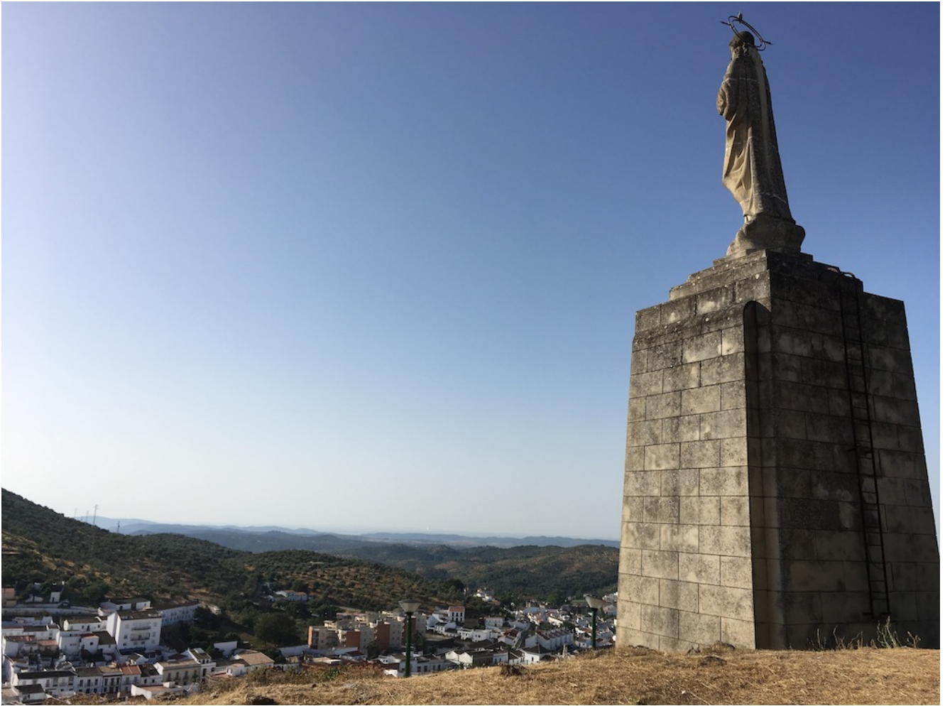
Vista desde el Castillo de Constantina