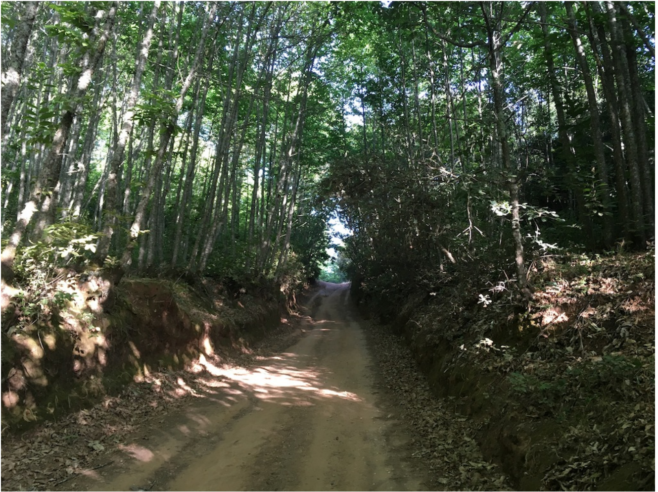
Castaños en Costantina

Quedaremos a las 20 horas en el Paseo de la Alameda, en el lugar que vemos en la imagen de abajo y cuyas coordenadas GPS son 37.877997, -5.621803. Para el viaje en autobús hace tres paradas para recoger en Sevilla: sale a las 17.30 horas de la Gran Plaza, 17:45 en José Laguillo y 18.00 en la Cervecería Ronda el Alamillo.