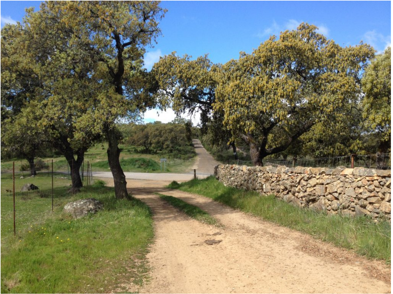
Cruce con la carretera