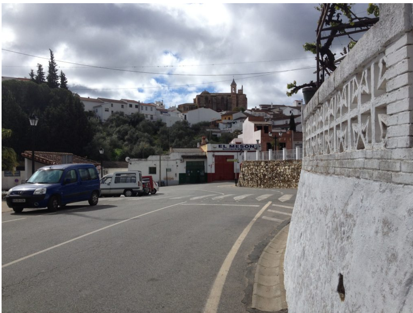
Bar El Piñonate junto a la carretera[/caption]

las Guardas y transcurre entre paredes de piedra seca. Para el autobús quedaremos en nuestras habituales paradas: 8:00 Gran Plaza (marquesinas del bus junto a la boca de metro), 8.15 José Laguillo (frente al Hotel Catalonia Santa Justa) y 8.30 Cervecería Ronda el Alamillo. Recomendamos llegar antes de la hora porque el bus sólo espera 5 minutos de cortesía como máximo. Pararemos a desayunar por el camino. Con los de los coches quedaremos a las 10 horas en el Bar El Piñonate que está en la Avenida Cruz de Marín ( coordenadas 37.693909, -6.313550 )