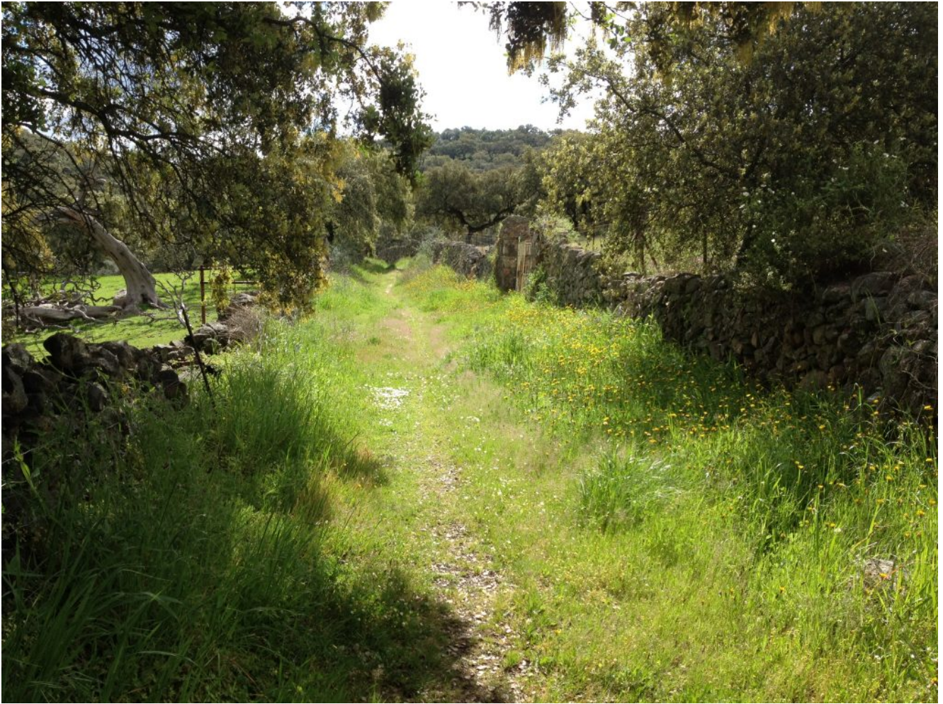
Recorrido del Sendero de los Callejones