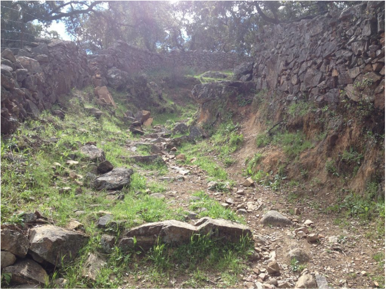
Surcos hechos por el agua