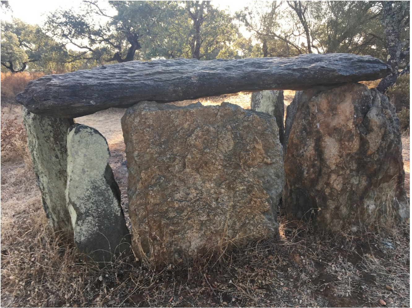
Dolmen en Valverde del Camino

Quedaremos a las 10.30 en el parking de Los Gabrieles que está ubicado en la A-493, 1 km antes de llegar a Valverde del Camino y cuyas coordenadas GPS son 37.558946, -6.735247. Podemos ver una imagen del lugar debajo de estas líneas.