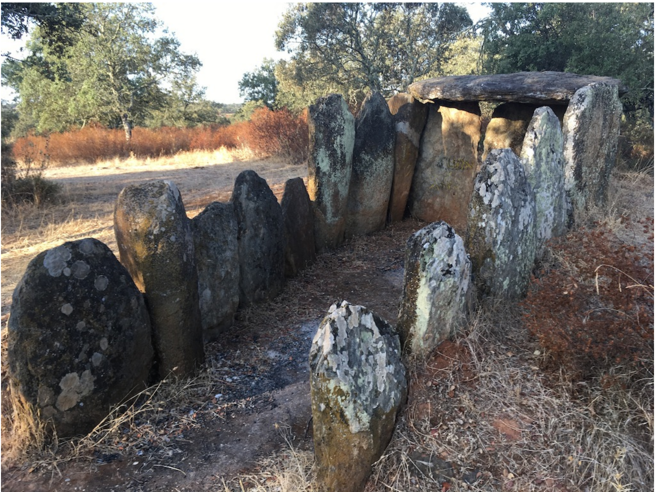
Dolmen Valverde del Camino

Senderismo en los Gabrieles es una excursión de nivel uno y dificultad fácil , que vamos a realizar el domingo 5 de noviembre en la localidad de Valverde del Camino. Caminaremos unos 8 km por la ruta que va visitando los grupos de dólmenes y en uno de ellos realizaremos una práctica de meditación, para todo aquel que quiera participar, en este lugar dotado de una especial fuerza telúrica. Es una excursión ideal para ir toda la familia y pondremos un autobús desde Sevilla.