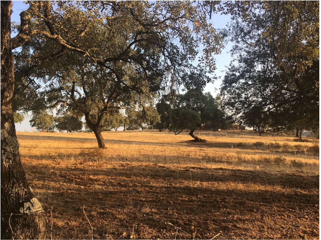
Dehesa de encinas

En uno de estos grupos de dólmenes haremos una sencilla práctica de meditación guiada por uno de nuestros técnicos y tras ella realizaremos la parada para comer los bocadillos que llevaremos cada uno.