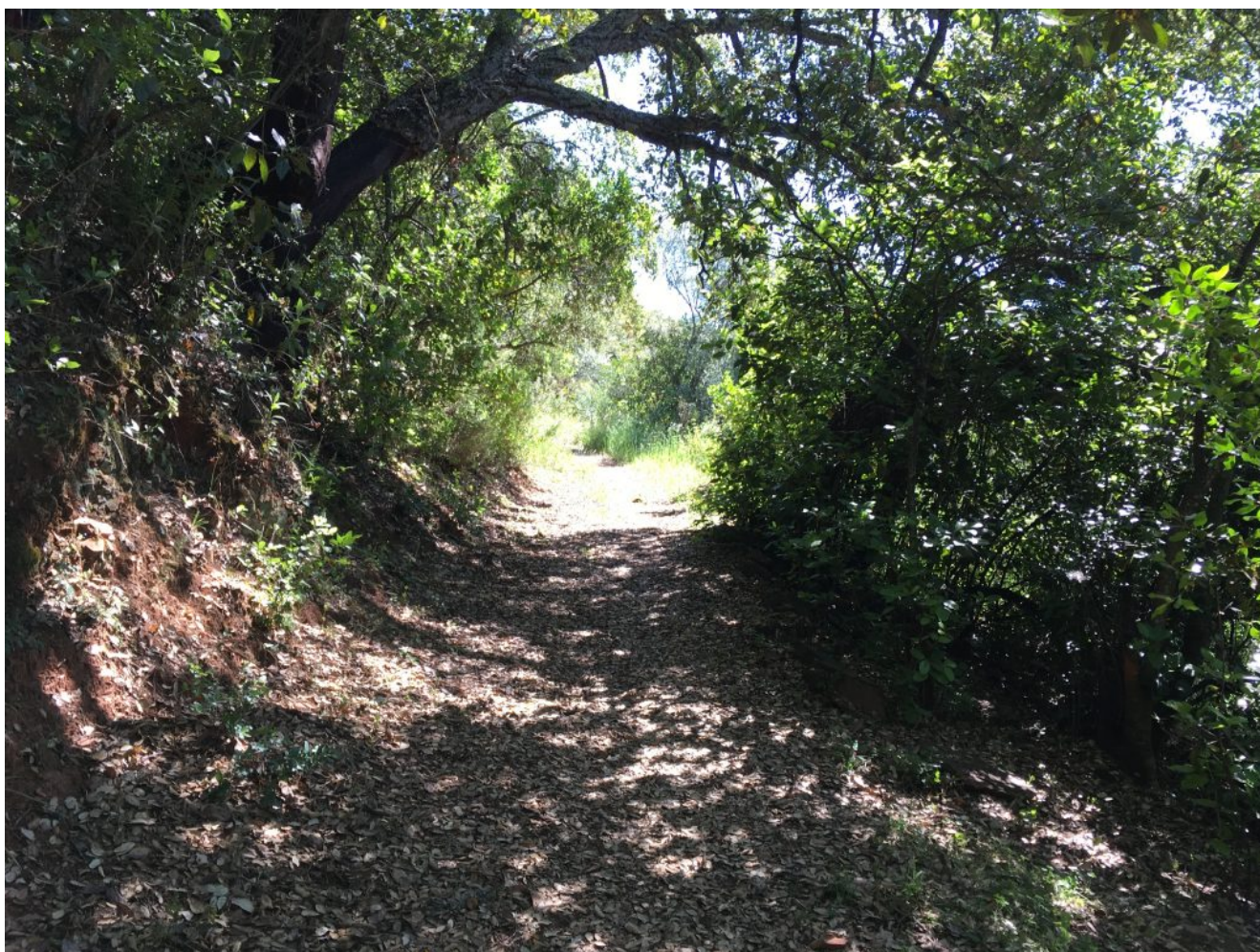
Sendero del túnel

transferencia en nuestra cuenta de Caixa Bank ES49 2100 7816 2902 0006 5540 y envíanos el resguardo a nuestro mail (reservas@senderismosevilla.net) con tu nombre y apellidos, número de DNI, fecha de nacimiento y un móvil de contacto. Información y reservas 600021260 y reservas@senderismosevilla.net