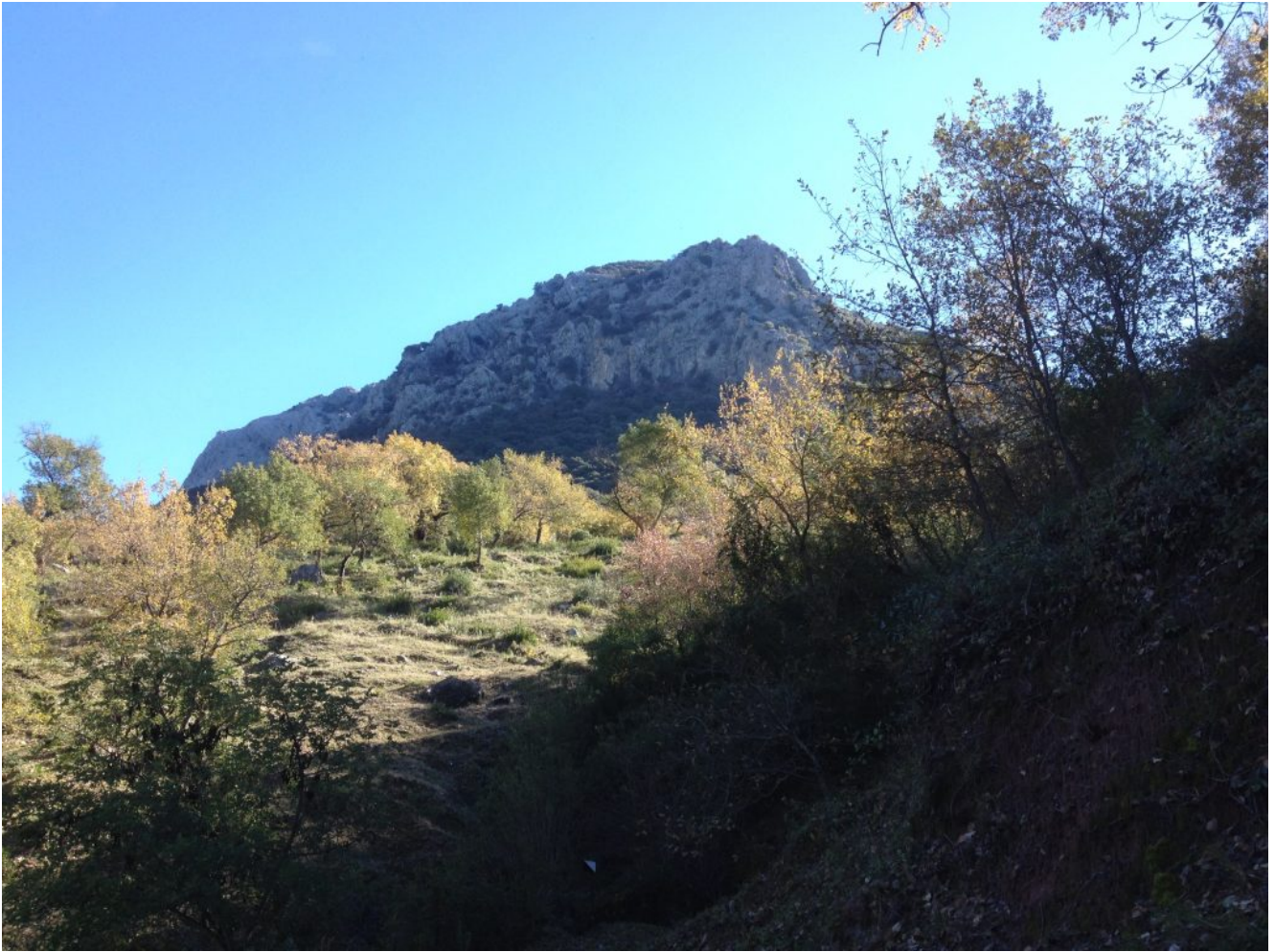
Montañas de Grazalema