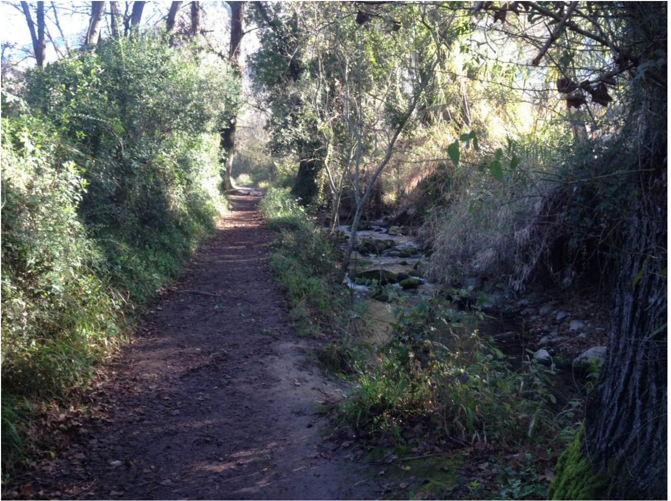
Sendero El Bosque