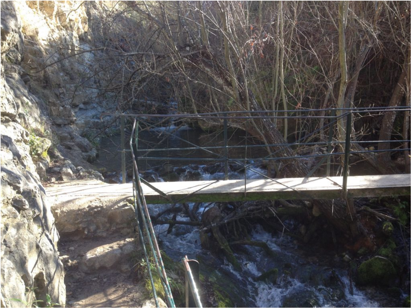
Puente sobre el río