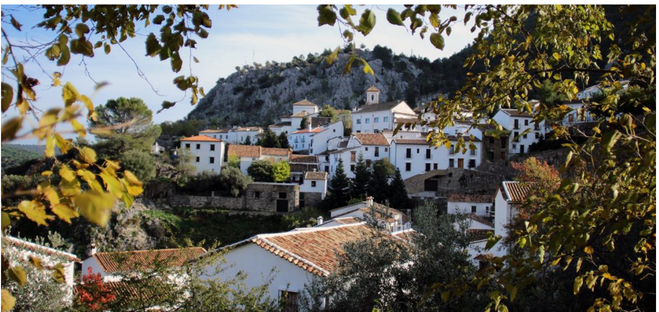
Vista de Grazalema