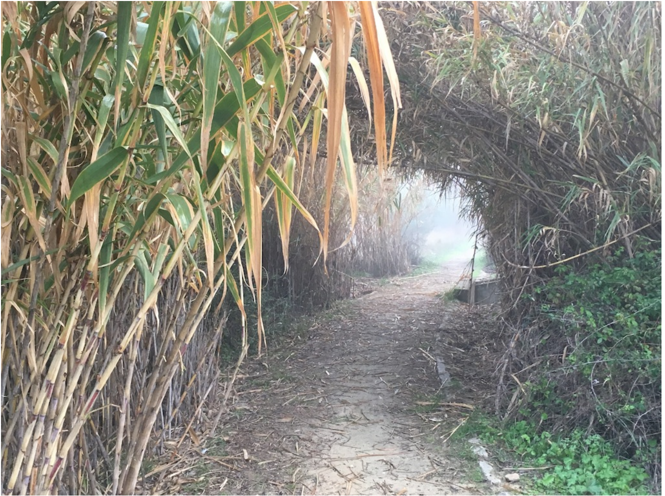
Detalle del sendero

Pasamos junto a los viejos molinos de trigo y centeno accionados por la corriente del agua del río hasta llegar al puente que cruza la carretera nacional que cruza el río.