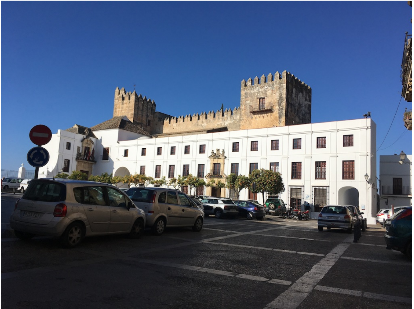
Castillo de Arcos

El precio de esta excursión es de 32€ y 18€ en coche (socios y niños menores de 18 años, 10€ menos) Para venir con nosotros tienes que realizar el proceso de inscripción para ello si vienes con nuestro transporte puedes hacer el pago por tarjeta accediendo a la pestaña de compra o por transferencia en nuestra cuenta de Banco Sabadell ES84 0081 7302 8200 0146 1452 y envíanos el resguardo al mail (info@senderismosevilla.net) con tu nombre y apellidos, número de DNI, fecha de nacimiento y un móvil de contacto.