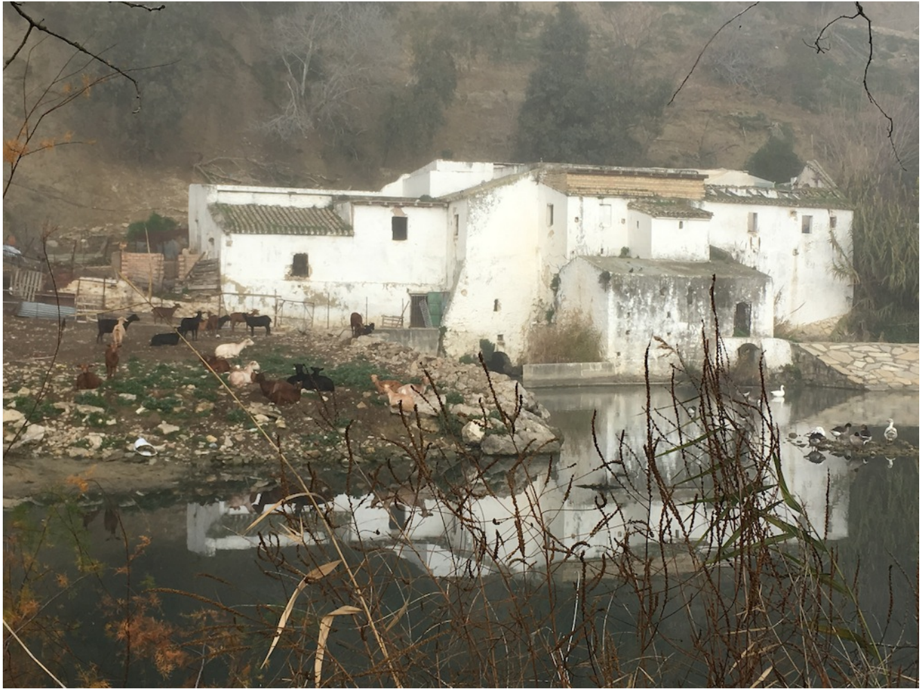
Molino de trigo