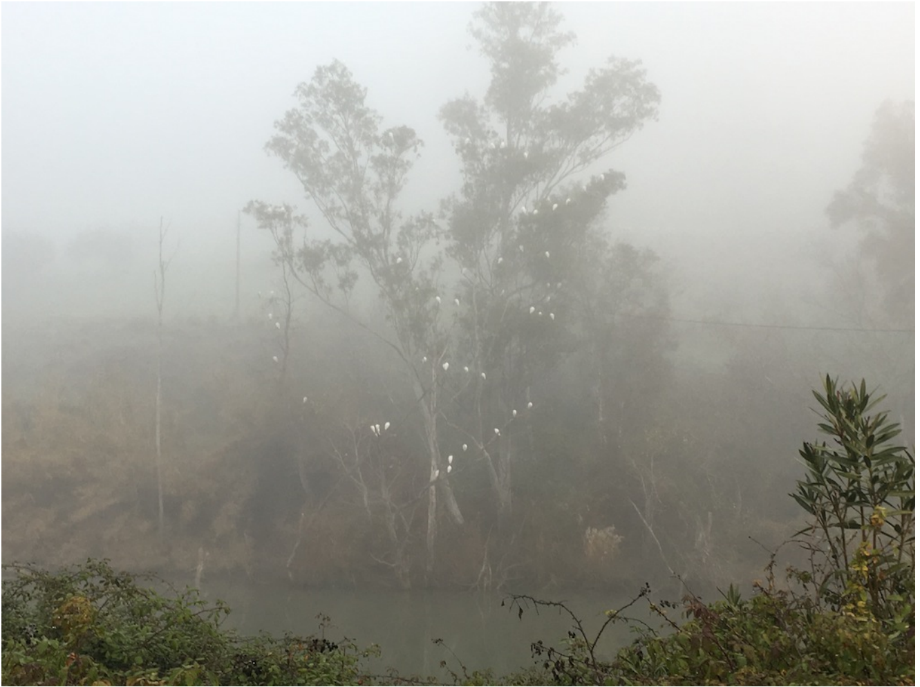
Ribera del Guadalete