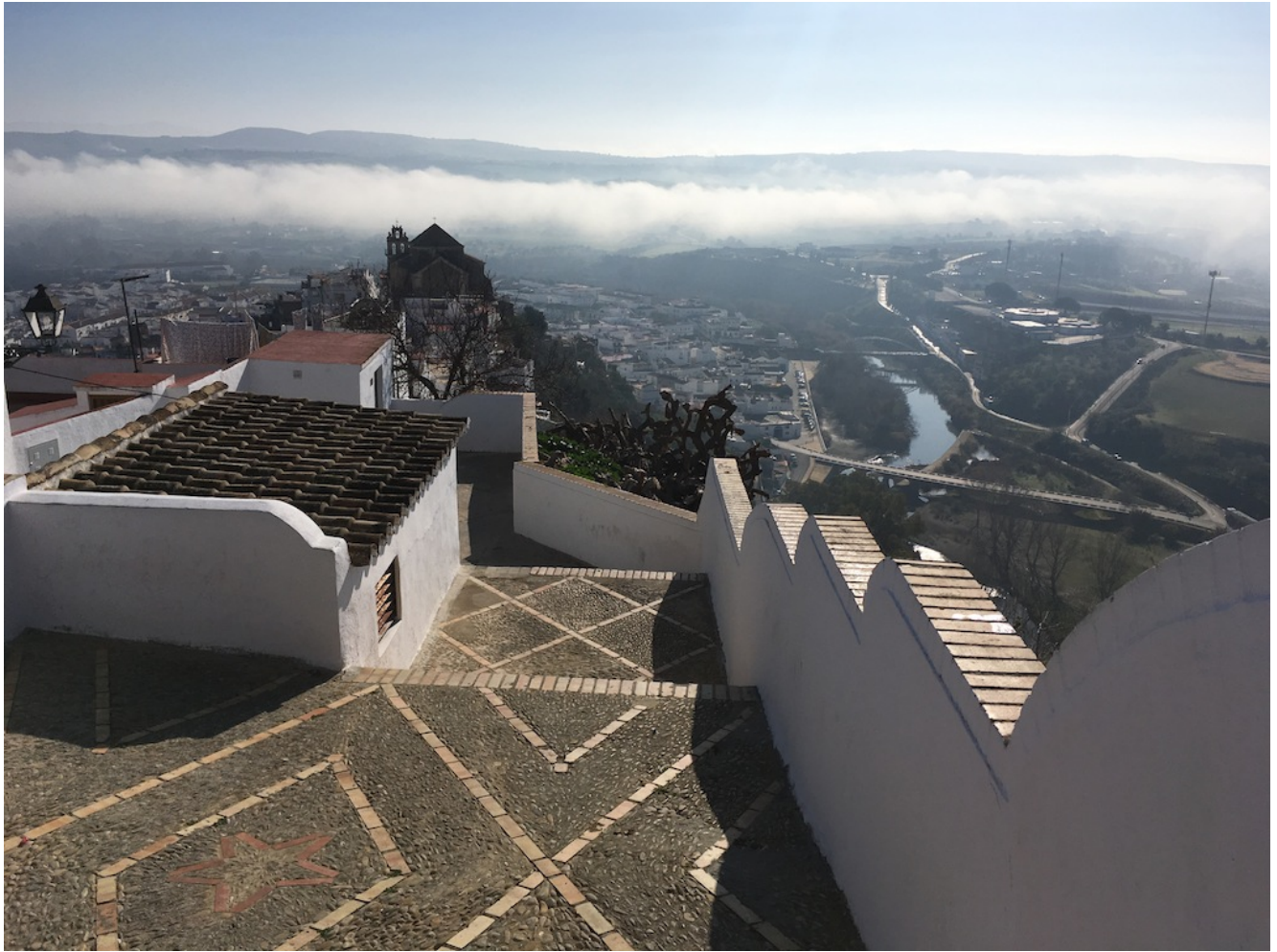
Balcón de la Peña

Culminaremos nuestro precioso recorrido por las calles de esta preciosa localidad. Tiempo libre hasta la salida del transporte de vuelta a Sevilla.