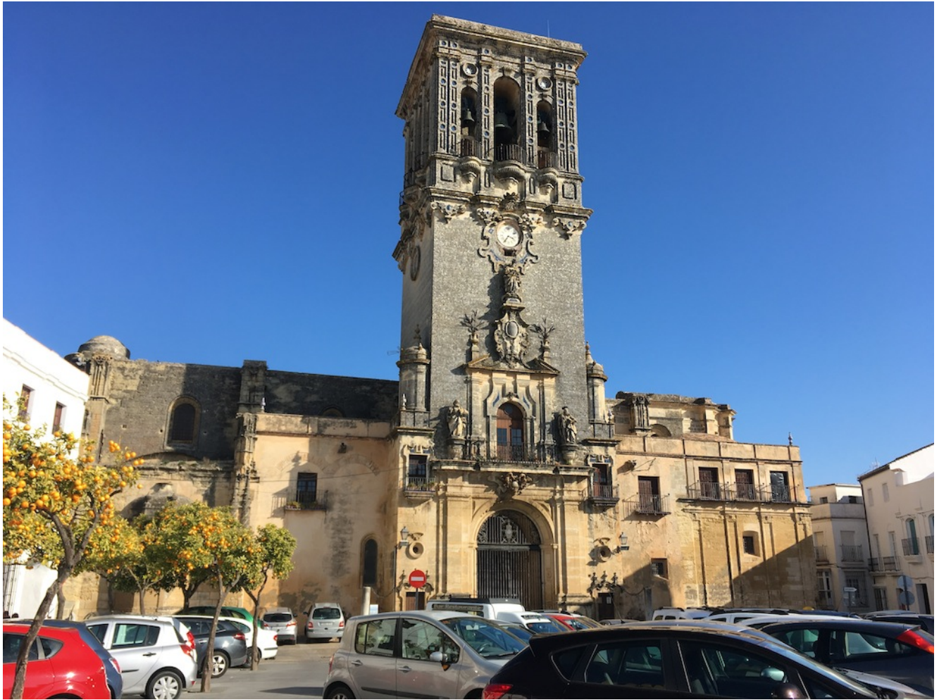
Basílica Menor de Santa María de la Asunción