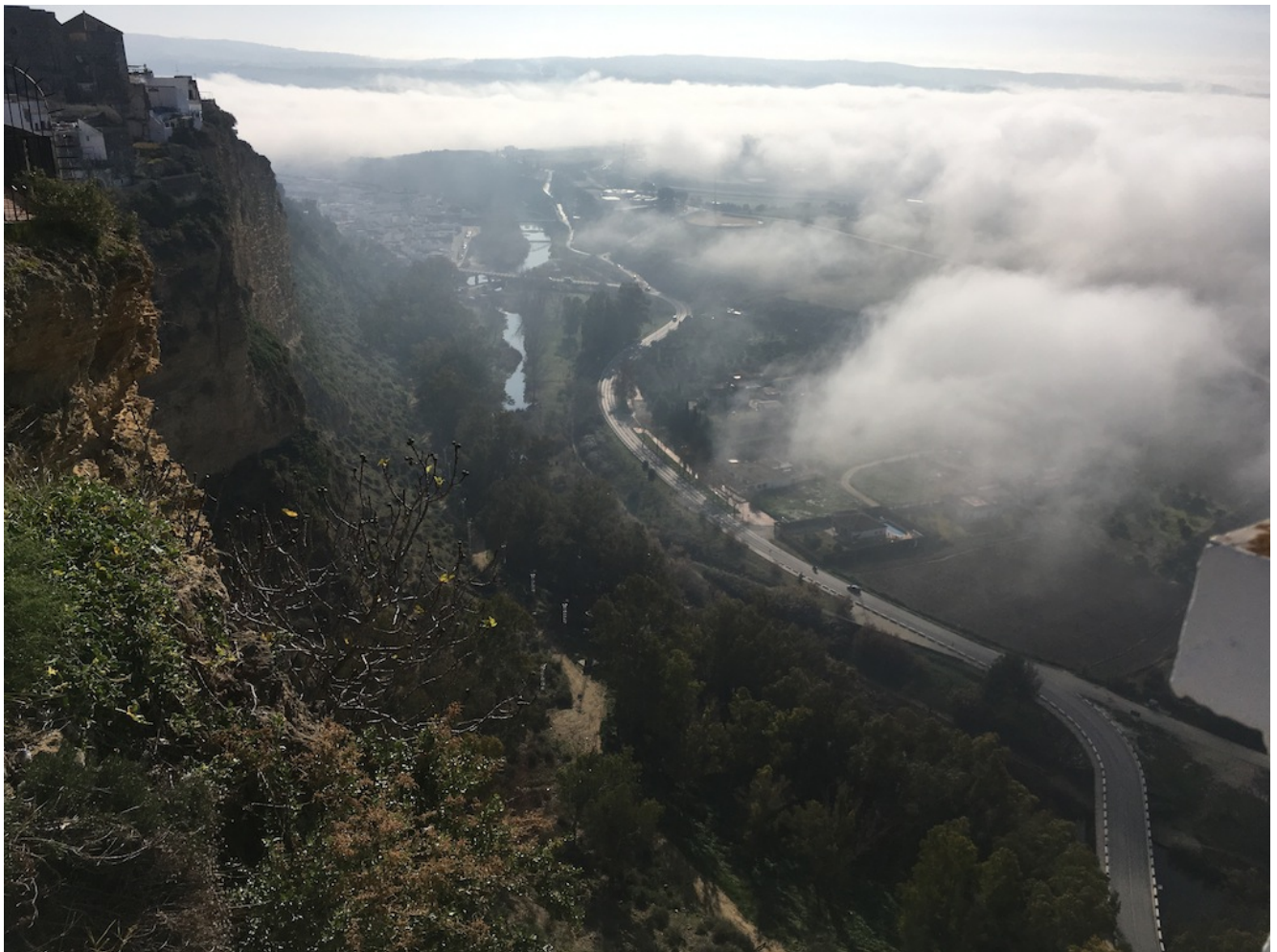
Río Guadalete desde Arcos

Nivel uno – El sábado 20 de diciembre de 2025 vamos a realizar el Sendero de las Huertas en Arcos de la Frontera. Es una ruta circular de nivel uno de 8,5 km y 147 metros de desnivel acumulado en subida en la que alternaremos un senderismo a lo largo del río y luego podremos disfrutar de las zambombas y demás actos de la Navidad, así como una bella iluminación Navideña. Pondremos transporte desde Sevilla para el desplazamiento y se puede llegar en coches particulares.