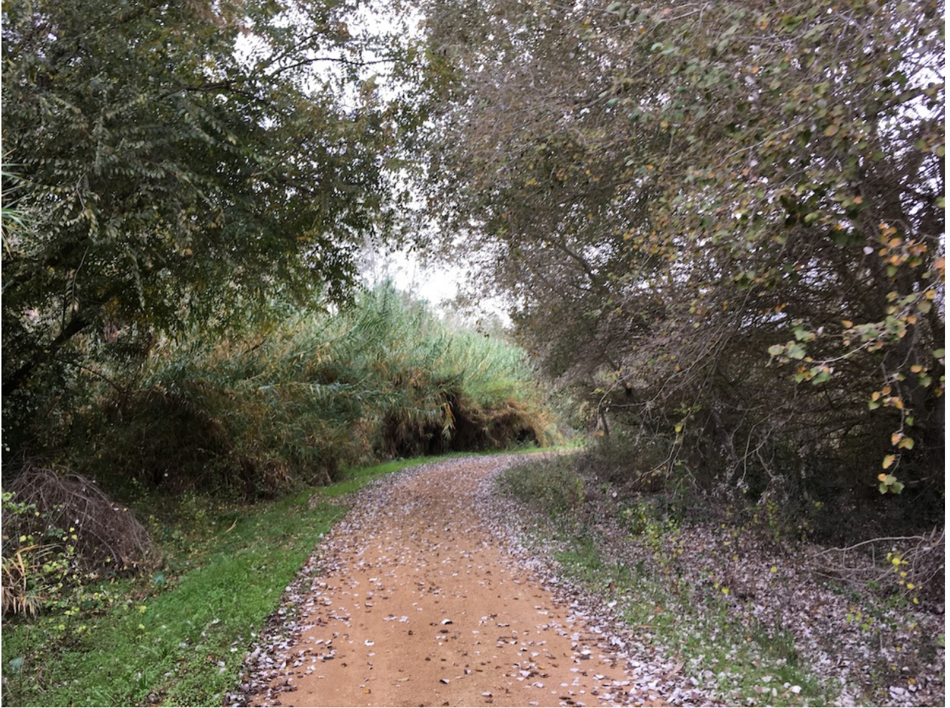
Sendero de vuelta