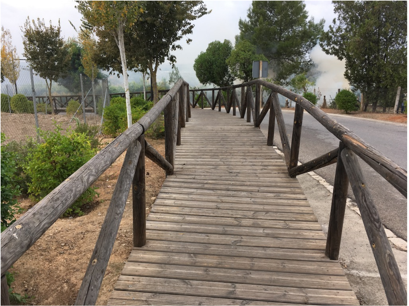
Pasarela del Guadiamar

El precio de esta excursión es de 18€ los adultos con autobús ( 8€ sin bus). Para venir con nosotros tienes que realizar el proceso de inscripción para ello si vienes en bus tienes que hacer el pago por tarjeta (botón bajo estas líneas), por transferencia en nuestra cuenta ES08 0182 3299 8202 0160 3487 y envíanos el resguardo al mail ( info@senderismo Sevilla.net ) con tu nombre y apellidos, número de DNI, fecha de nacimiento y un móvil de contacto. Si vienes en coche puedes pagar en la propia excursión pero tienes que enviarnos tus datos por mail o rellenar el formulario de abajo (uno por persona que venga).