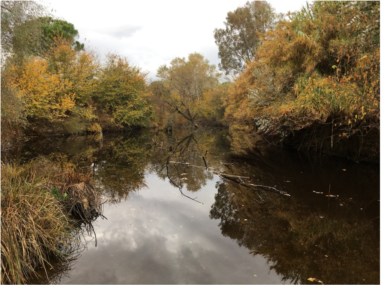
Vado del Quema

Adjuntamos una bella galería de imágenes en la que los colores otoñales como los diferentes marrones contrastan con los azules de las aguas dando como resultado bellos colores de contrastes.