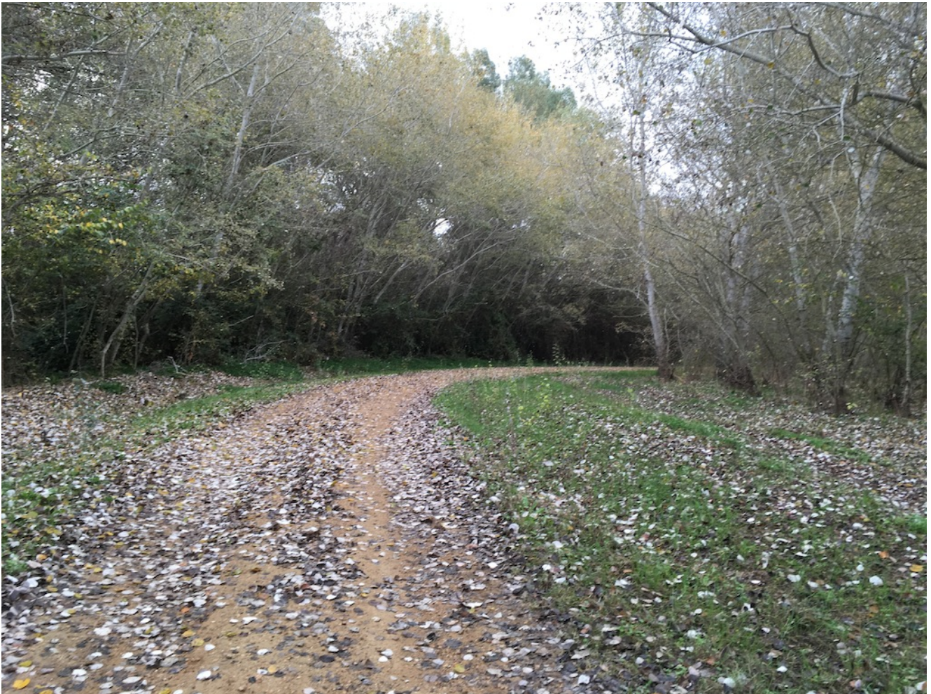
Sendero del Guadiamar

Nivel dos- 10 de Febrero. El Sendero del Guadiamar es una excursión de nivel dos de 19 km y 46 metros de desnivel acumulado en subida que se desarrolla en la población de Aznalcazar. Es una preciosa ruta moderada que tiene varios atractivos: el recorrido por la rivera, la llegada al Vado del Quema donde almorzaremos con los compañeros del nivel uno que vienen de su ruta y las actividades accesorias que os vamos a proponer en el Centro de Visitantes Guadiamar. Una jornada muy completa para la que pondremos un bus desde Sevilla.