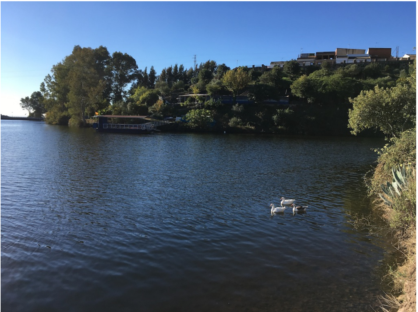
Embalse de Bembezar

Nivel dos- El sábado 26 de noviembre de 2022 vamos a realizar el Sendero de los Ángeles, una ruta lineal de ida y vuelta de 12 km y 250 metros de desnivel acumulado en subida siguiendo el cauce del embalse de Bembezar. Es una excursión fácil dentro del nivel dos . Pondremos autobús desde Sevilla como siempre y se puede llegar en coches particulares.