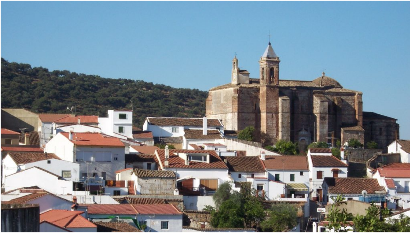
Localidad del Castillo de las Guardas

Para los que vengan en bus quedaremos en nuestras habituales paradas: 8:00 Gran Plaza, 8.15 José Laguillo y 8.30 Cervecería Ronda el Alamillo, parando a desayunar en el propio Castillo de la Guardas y volveremos para Sevilla a las 17 horas, llegando a la primera parada de Sevilla a las 18.00 horas. Con los de los coches quedaremos a las 10.00 horas en el parking que está enfrente del cementerio del Castillo de las Guardas (ver foto) y que tiene las coordenadas 37.693865, -6.310236. Se llega allí desde Sevilla por la Ruta de la Plata, camino de Aracena y desviándonos hacia el Castillo de las Guardas.