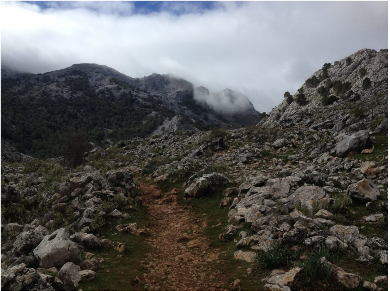
Senderos en Graza lema