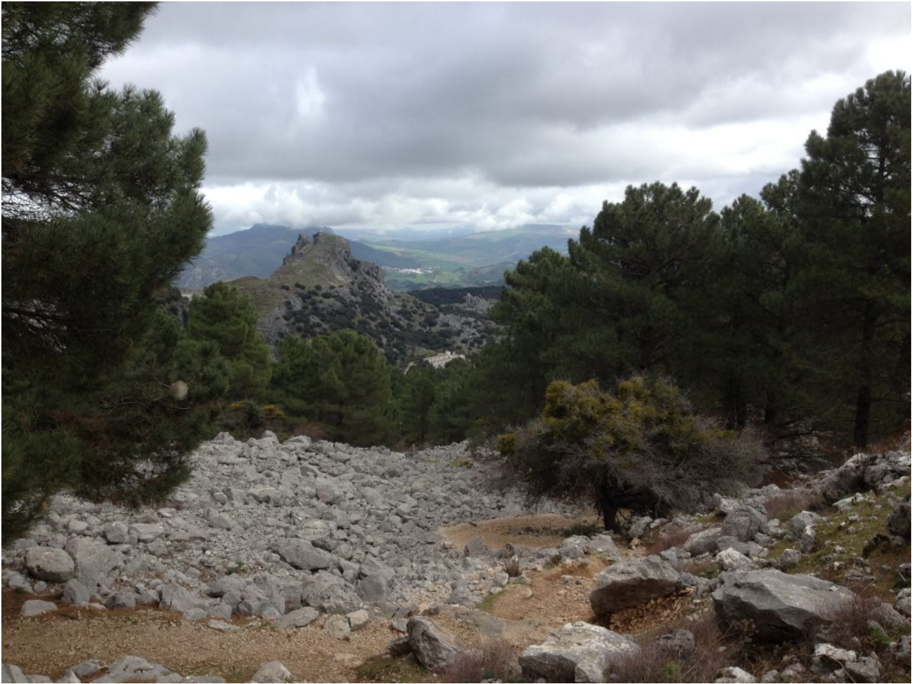
Vista de Grazalema desde la subida