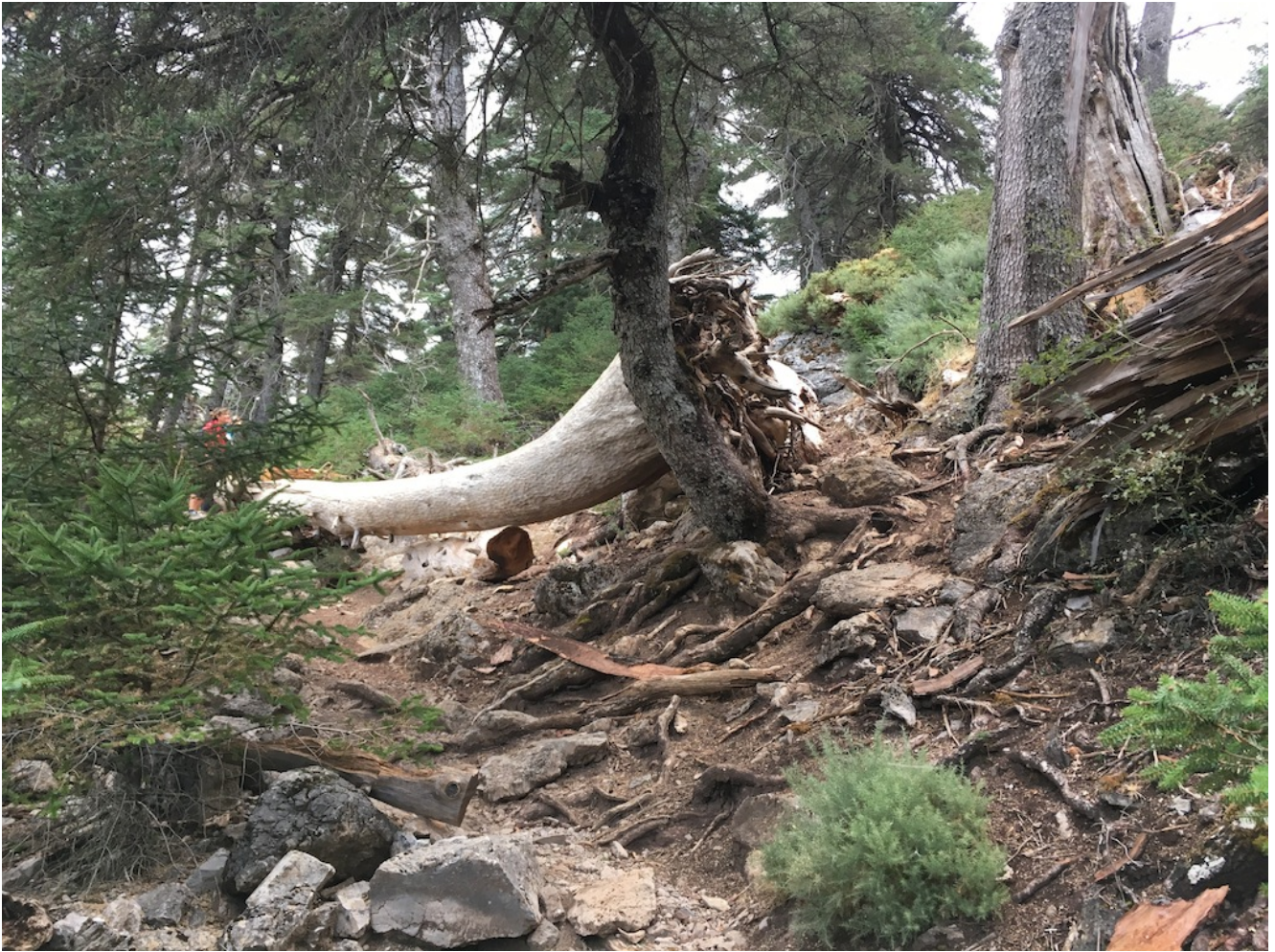
Antiguos bosques de Pinsapos