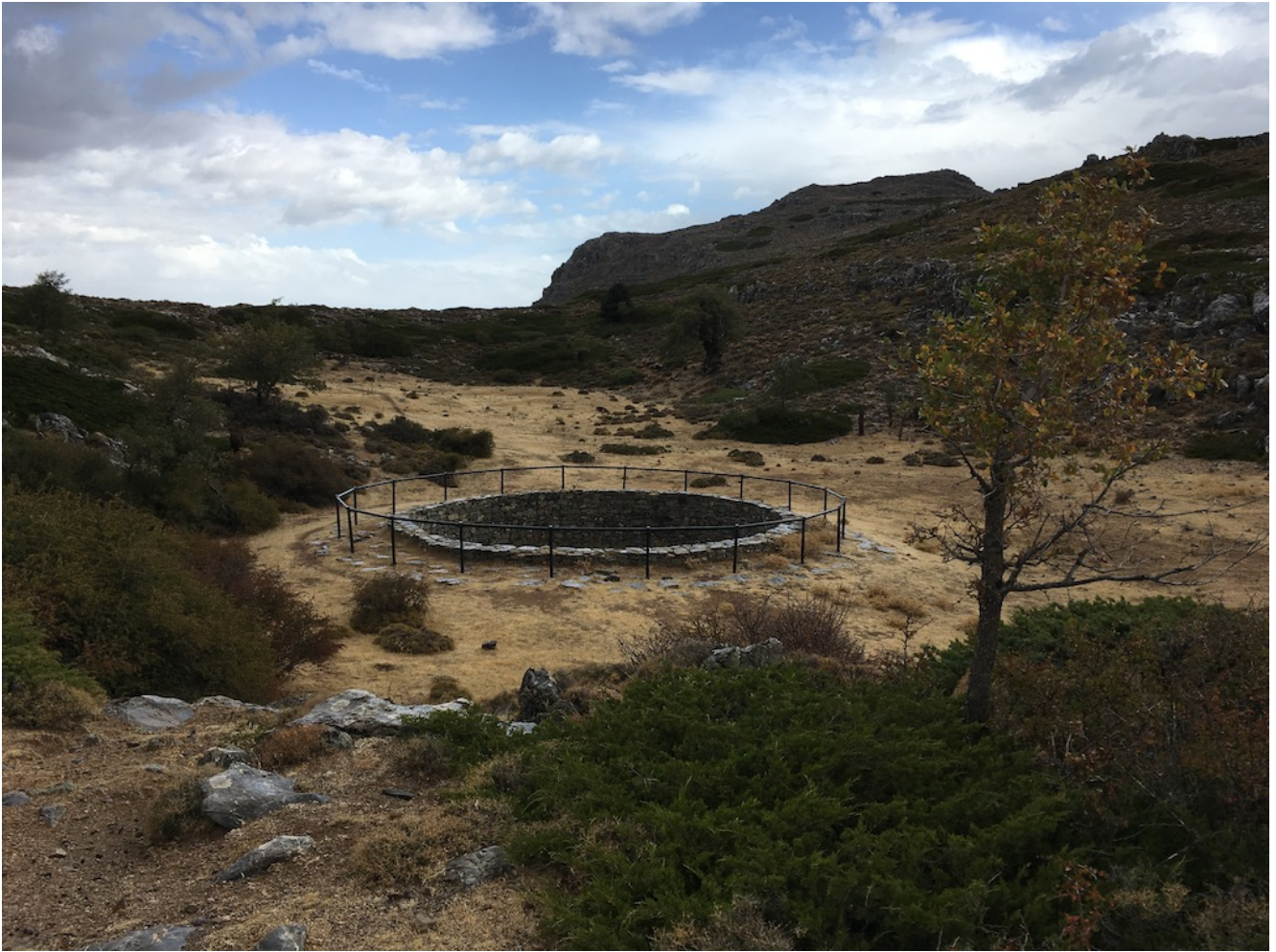
Pozos de nieve