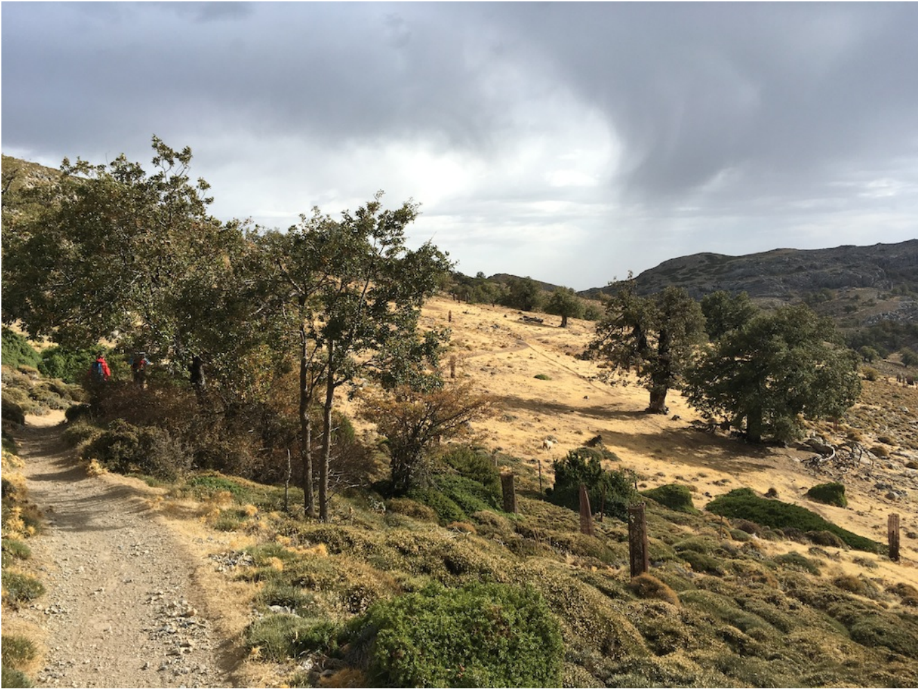
Entre quejigos de alta montaña