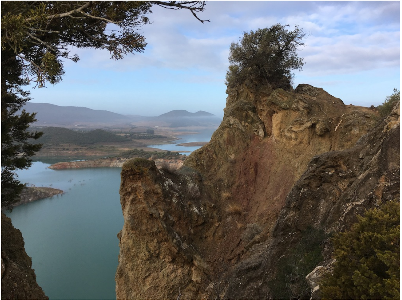
Formas frente al agua