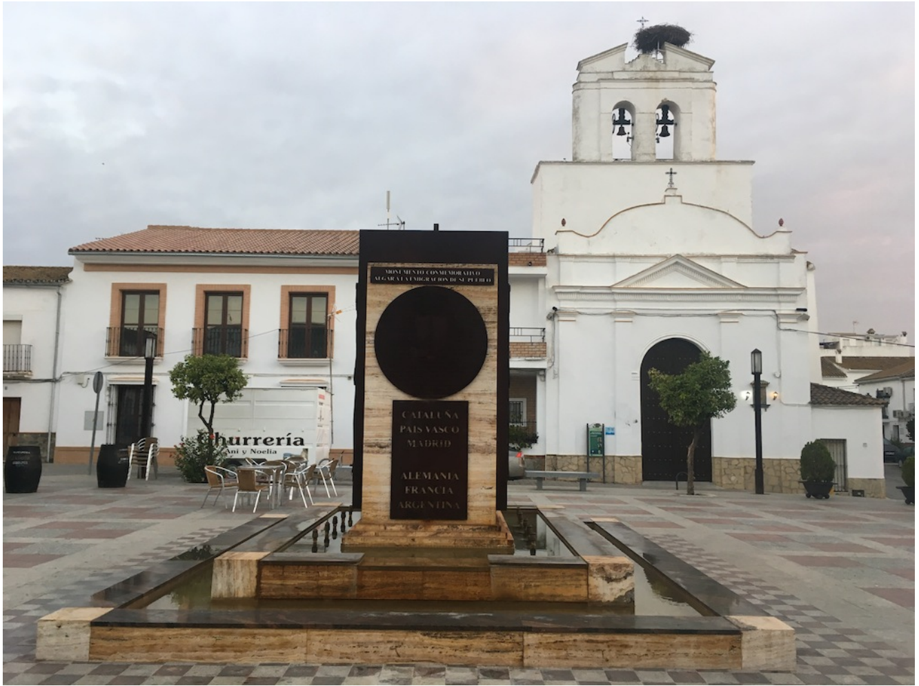
Iglesia de Algar

Quedaremos a las 10 horas junto a la Plaza de Toros del pueblo Algar cuyas coordenadas GPS son 36.658199, -5.654899 y cuya imagen podemos ver debajo de estas líneas. Para el viaje en autobús hace tres paradas para recoger en Sevilla: sale a las 7.00 Metro de la Gran Plaza, 7.15 José Laguillo frente al hotel Santa Justa y 7.30 en la Cervecería Ronda el Alamillo