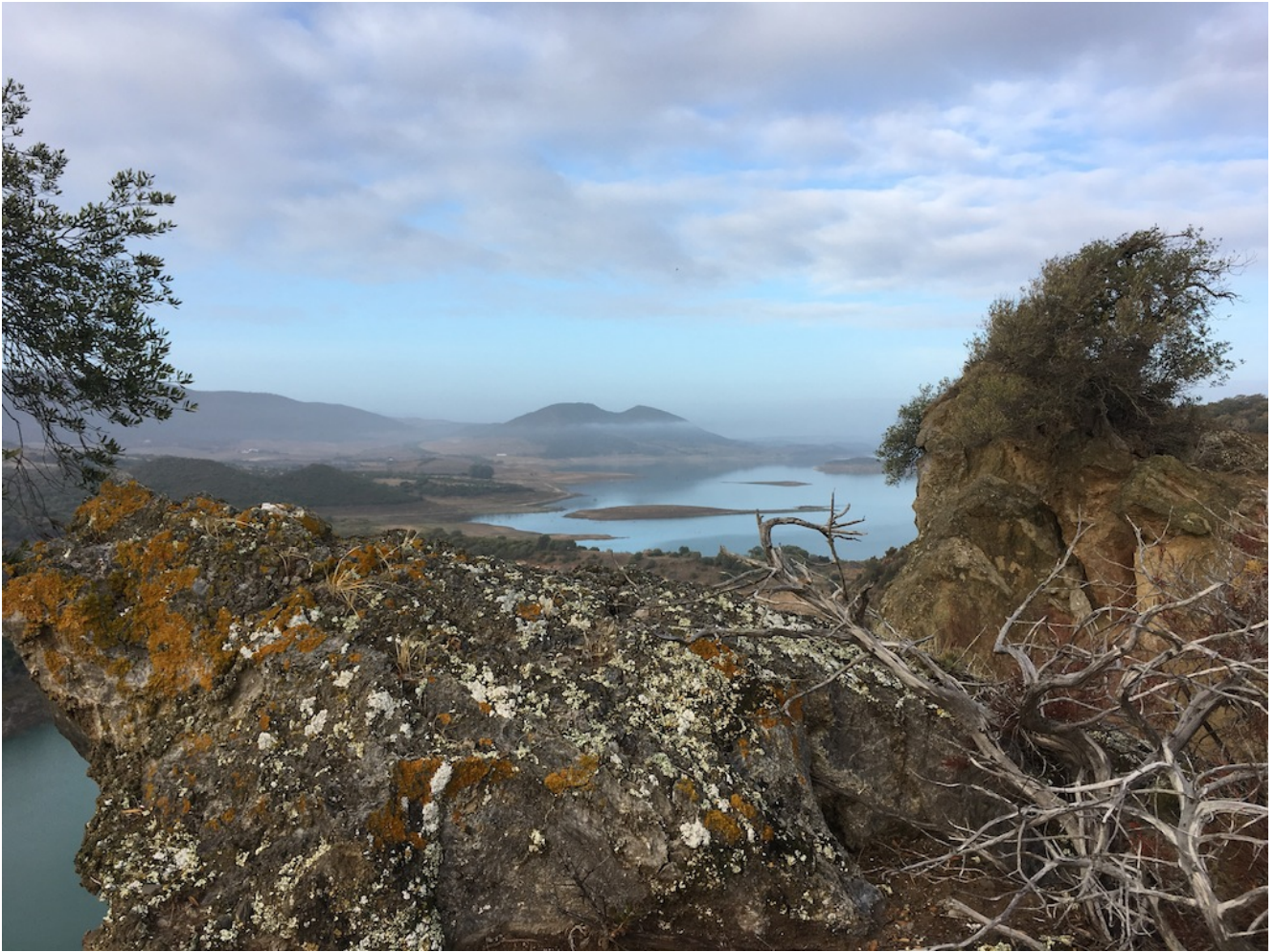
Embalse de Guadalcacín