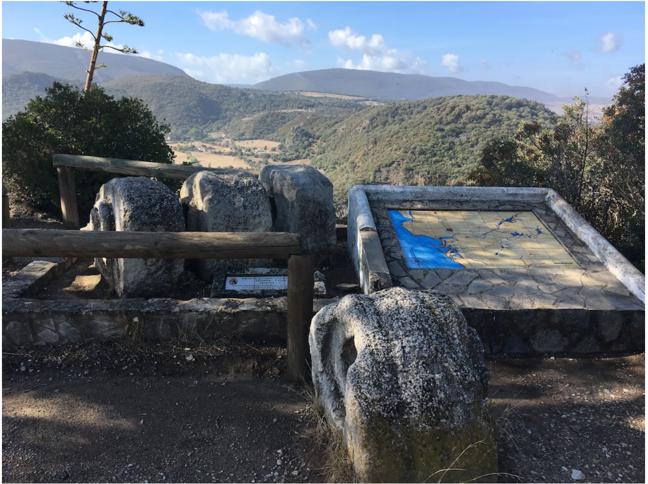
Restos acueducto del Tempul

El precio de esta excursión es de 25€ con autobús y de 15 sin autobús (socios 10€ menos siempre). Si quieres venir con nosotros tienes que realizar el proceso de inscripción para ello puedes hacer el pago por tarjeta (botón de abajo) o por transferencia en nuestra cuenta de Banco Sabadell ES84 0081 7302 8200 0146 1452 y envíanos el resguardo a nuestro mail ( info@senderismosevilla.net ) con tu nombre y apellidos, número de DNI, fecha de nacimiento y un móvil de contacto.