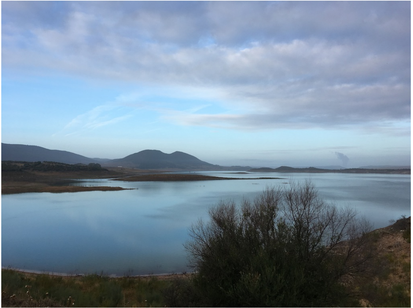
Embalse de Guadalcacín