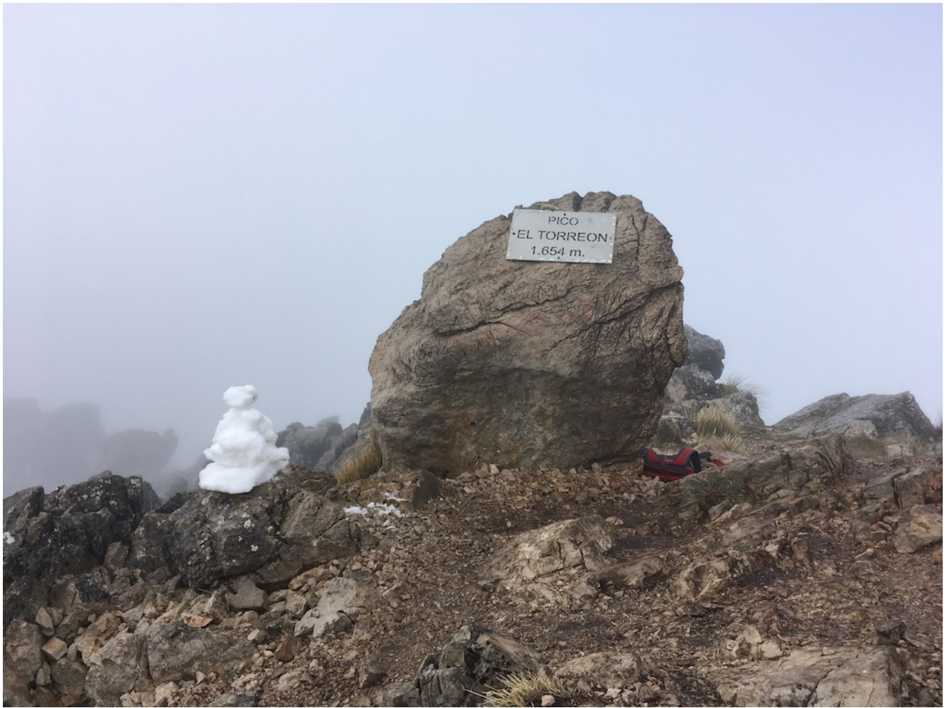
Cima del Torreón

La bajada es larga y peligrosa , recomendamos no relajarse demasiado porque la plenitud que nos proporciona el haber llegado a nuestra meta puede proporcionarnos una euforia que nos haga confiarnos y bajar en nuestras precauciones para no caernos