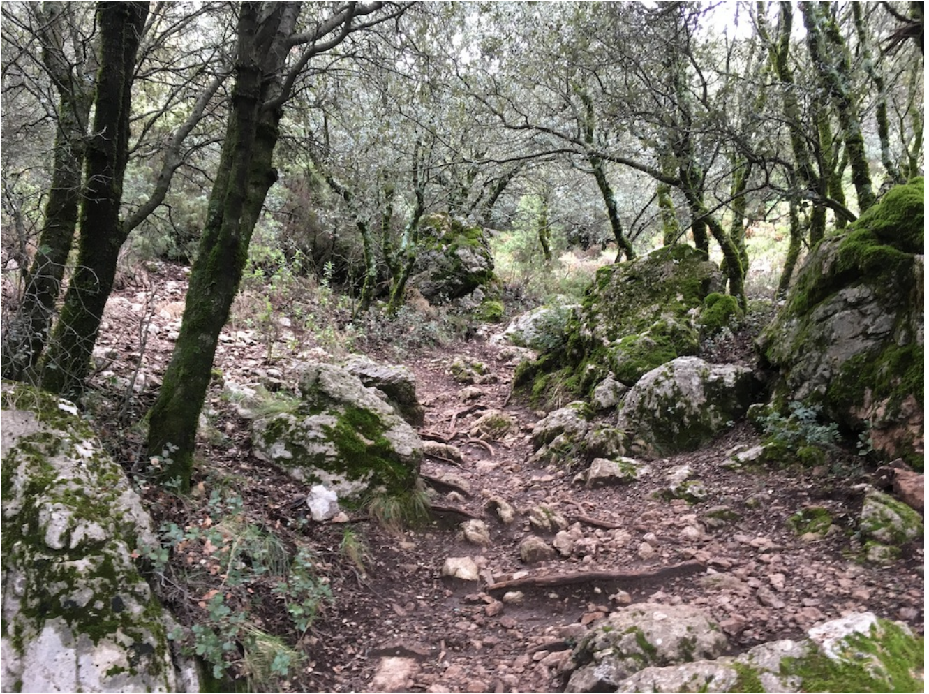
Sendero de encinas y matorral