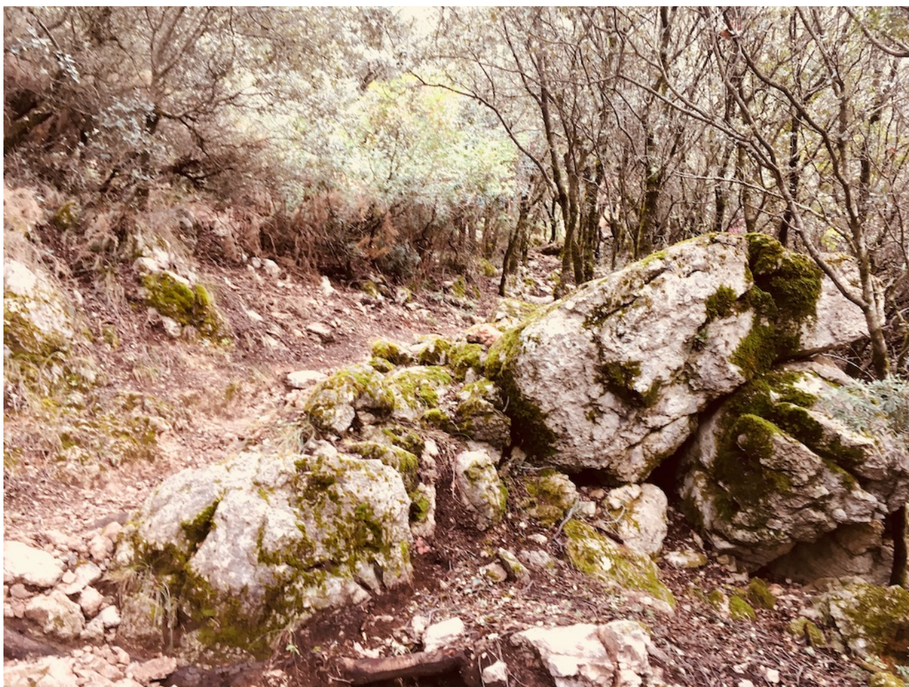
Estampa del camino

concentrándote en tu respiración. No mirar hacia arriba en ningún momento, sino donde pisas y tomando aire a menudo, afrontar esta dura prueba.