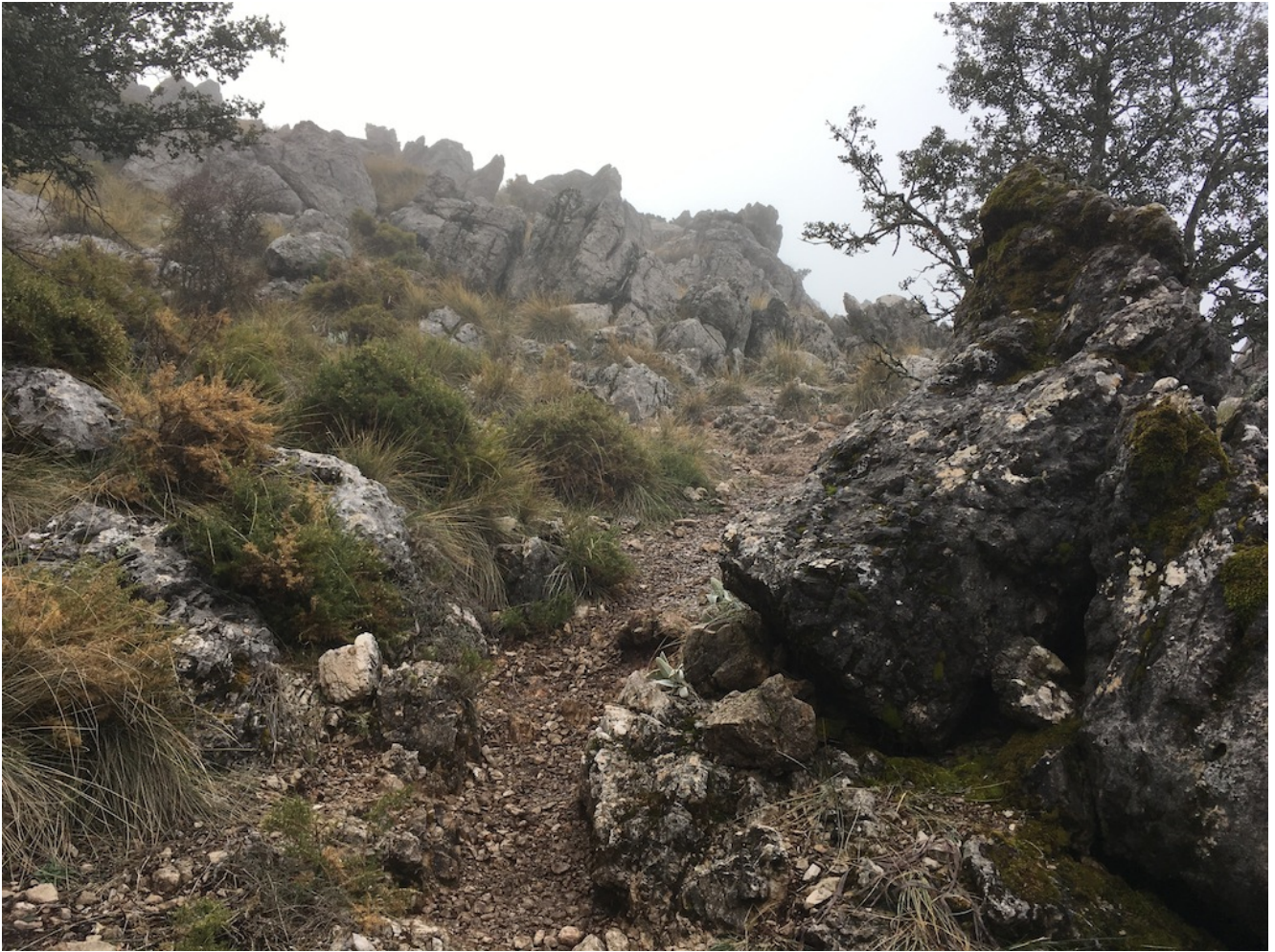
Segunda parte del sendero