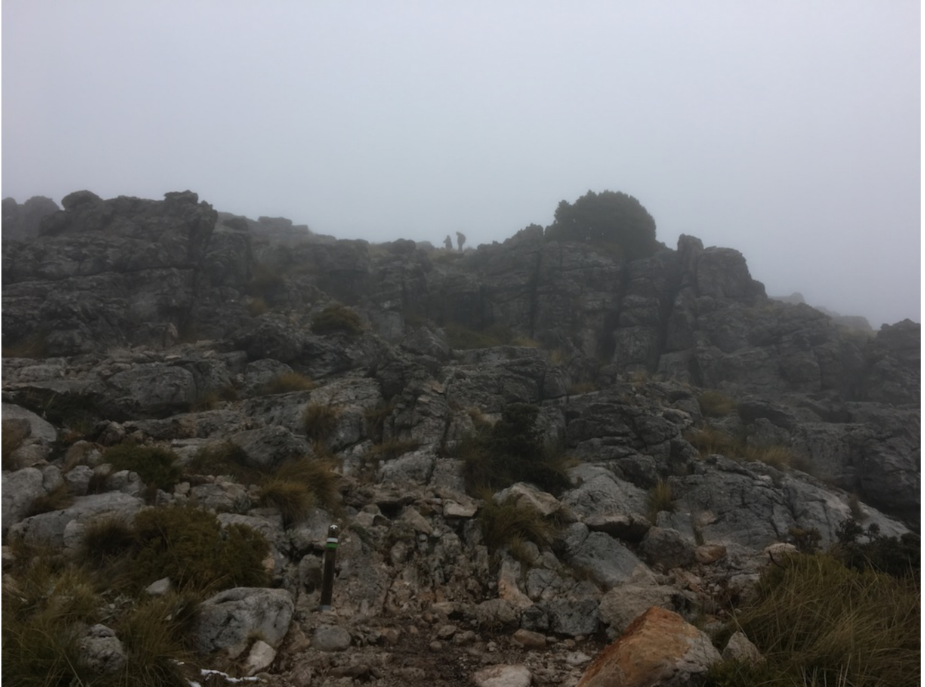
Cima del Torreón

hora y media de subida a buen ritmo y desde el minuto uno hasta que se alcanza la cima pone a cada uno en su sitio. Es sólo recomendable para senderistas en un estado óptimo de forma.