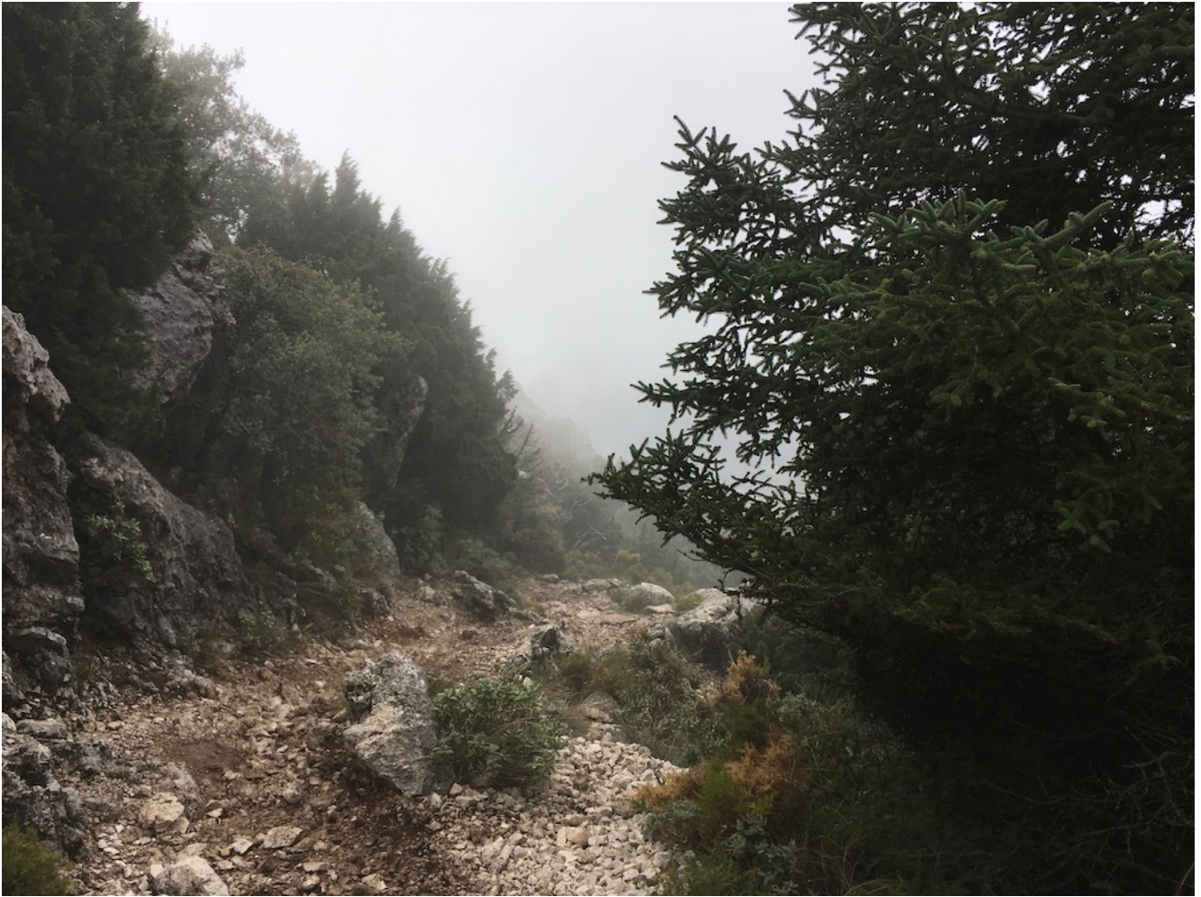
Pinsapo en la bajada