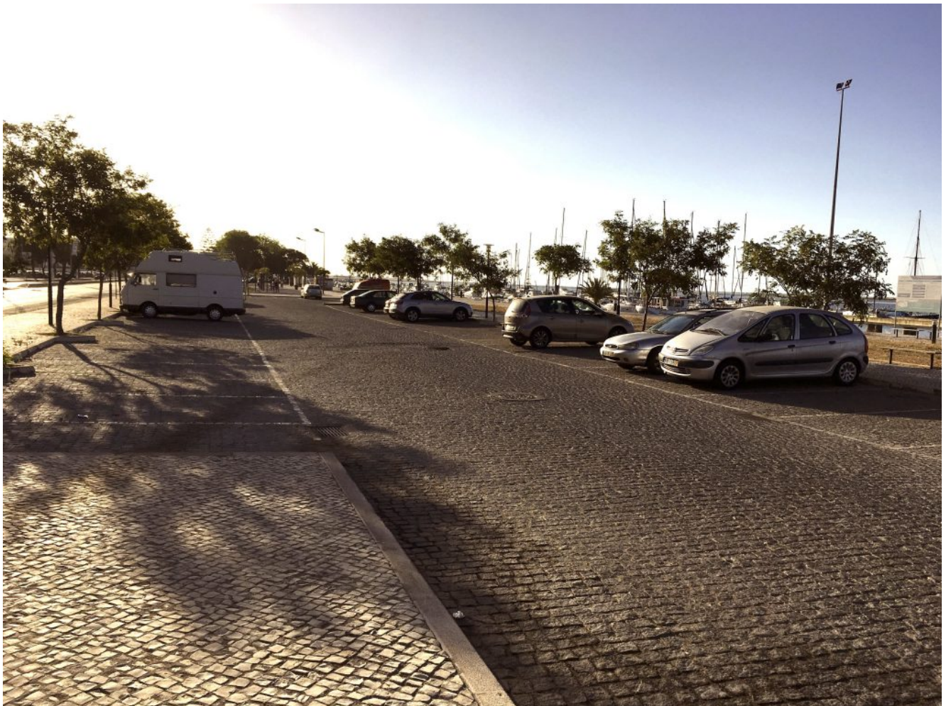
Lugar de estacionamiento Olhao

horas (8.30 horas en Portugal). Nos dejará en la Avenida 5 de Outubro cuyas coordenadas son 37.023790, - 7.848307, (imagen 1) este es el lugar perfecto para dejar el vehículo los que vengáis en coche. Y 200 metros más adelante está el embarcadero cuyas coordenadas son 37.024058, -7.838013 (imagen 2), donde quedaremos para salir en el ferry de las 10 horas (9 horas hora portuguesa). Hay que ser puntual porque el ferry es cada dos horas y los billetes no se pueden comprar anticipadamente.