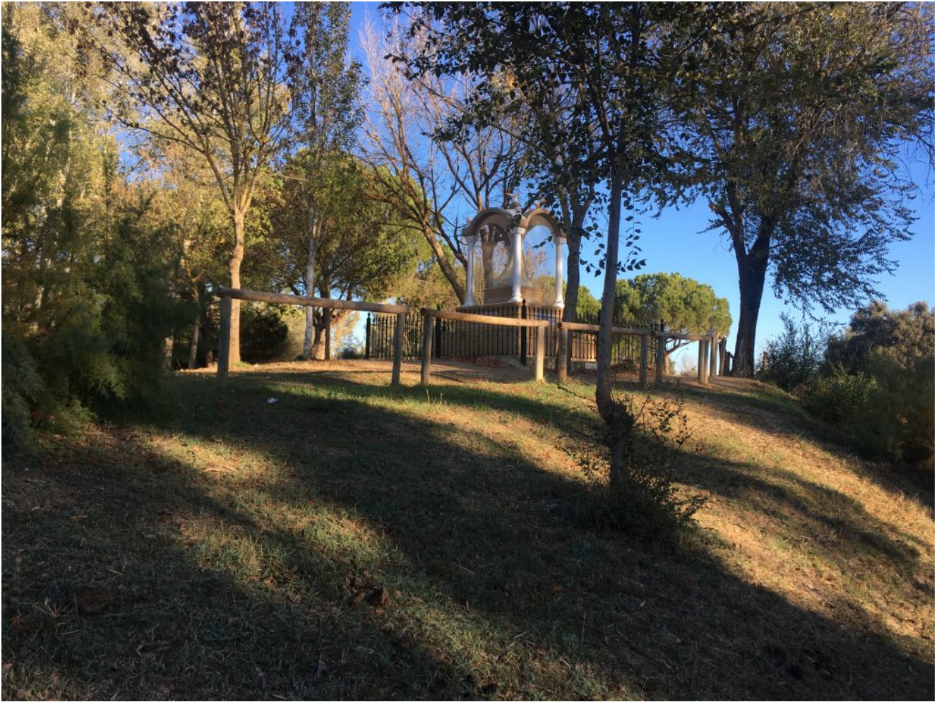
Virgen del Rocio

Adjuntamos una bella galería de imágenes en la que los colores otoñales como los diferentes marrones contrastan con los azules de las aguas dando como resultado bellos colores de contrastes.