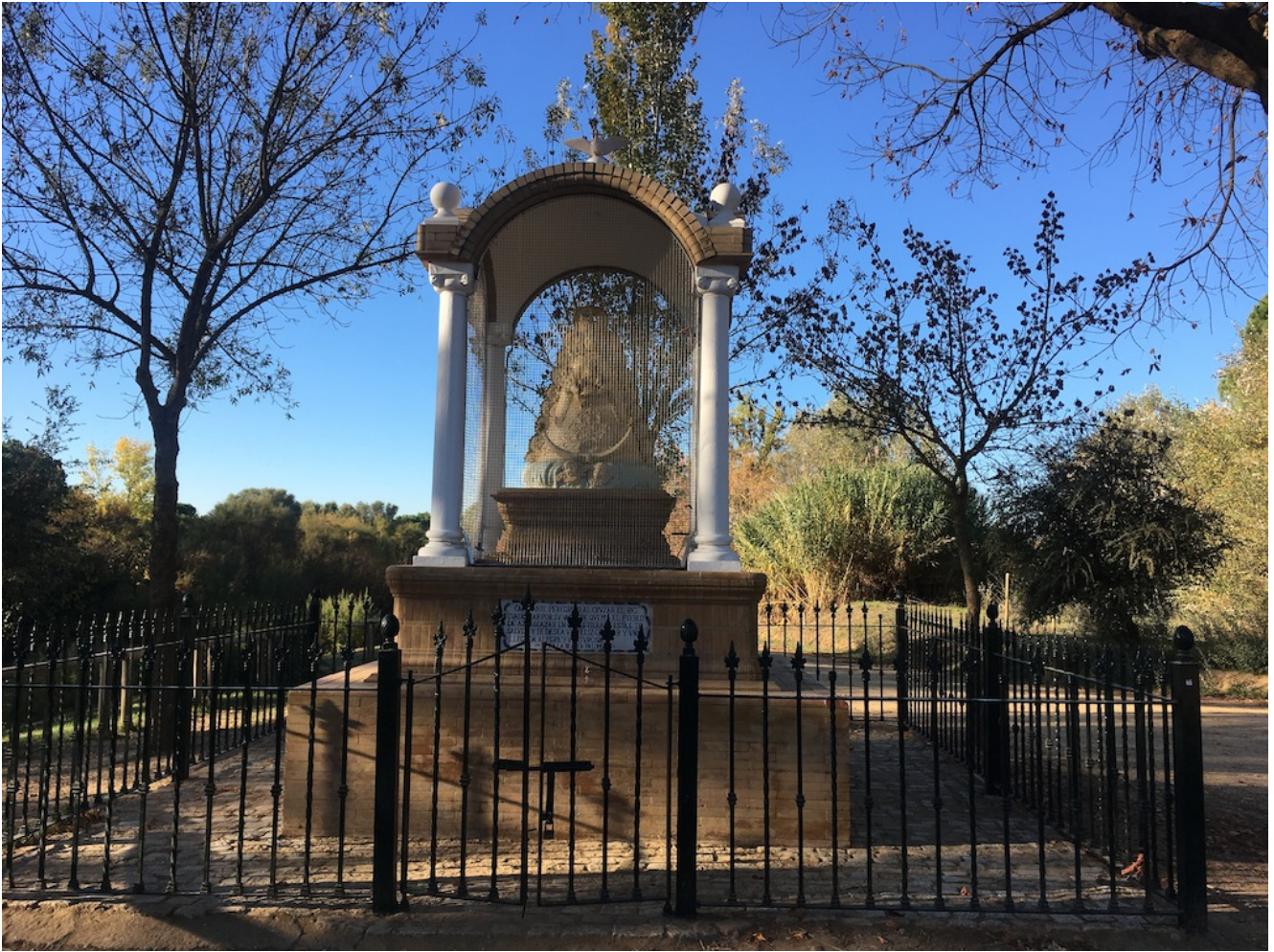
Virgen del Rocío

El Rocío, para rendir pleitesía a la Virgen del Rocío.