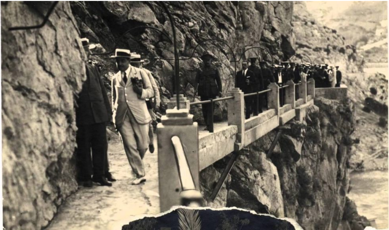
Imagen antigua del Caminito del Rey

“saltos de agua” para facilitar tanto el paso de los operarios de mantenimiento como el transporte de materiales y la vigilancia de los mismos.