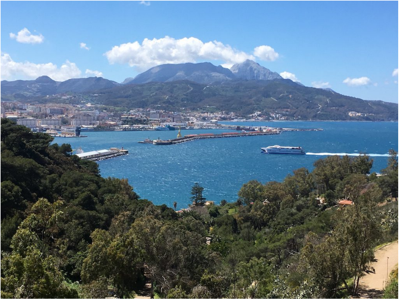
Circular Jbel Musa: 12 km y 680 de desnivel acumulado