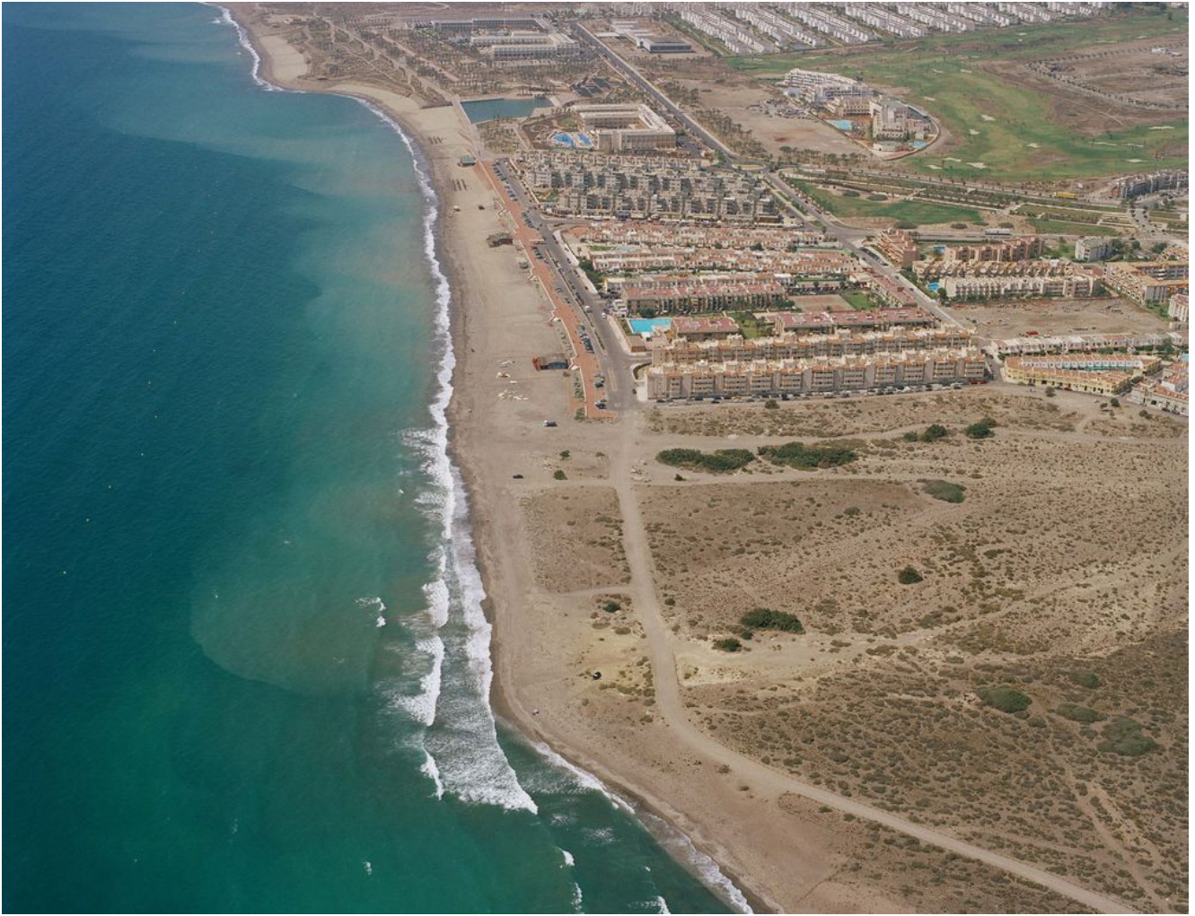
Jueves 23 de septiembre. Arrecife de las Sirenas