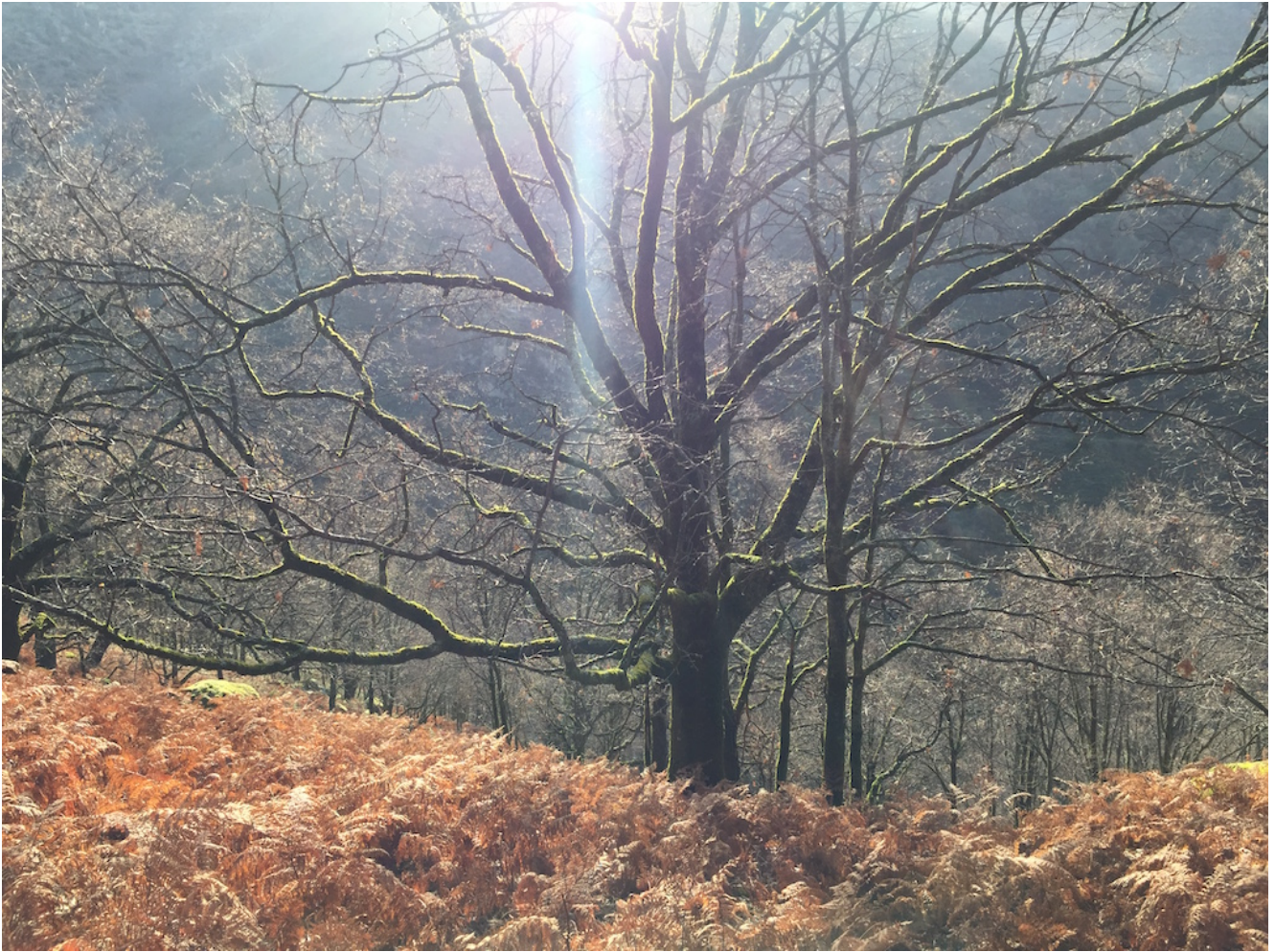
La Garganta de los Infiernos- Los Pilones Nivel uno: 6,5 km y 250 metros de desnivel Nivel dos: 14,2 km y 550 metros de desnivel