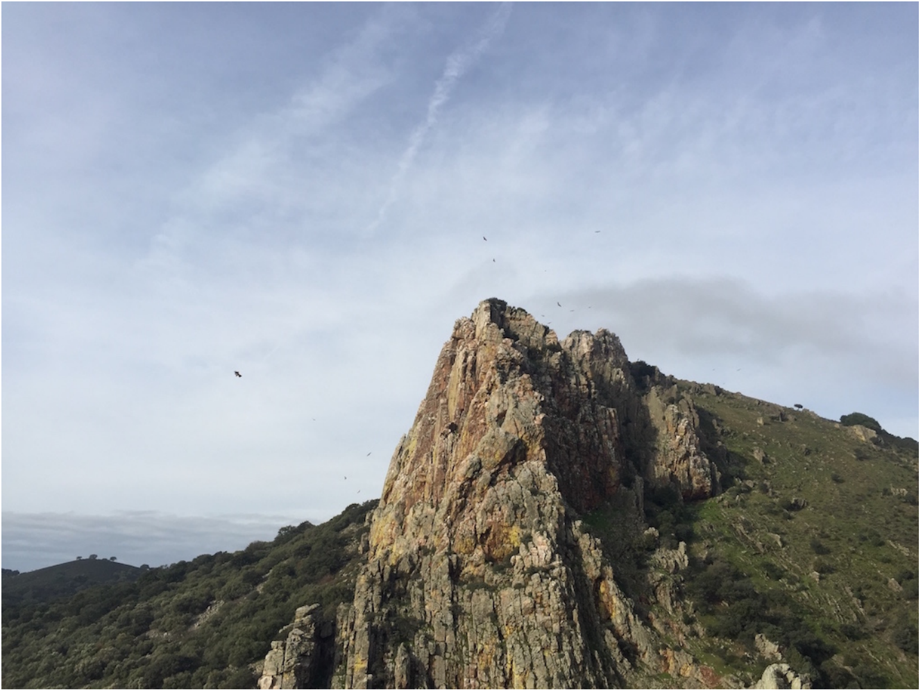
El Castillo de Monfragüe- Torrejón el Rubio Nivel uno: 13,5 km y 230 metros de desnivel Nivel dos: 16 km y 480 metros de desnivel