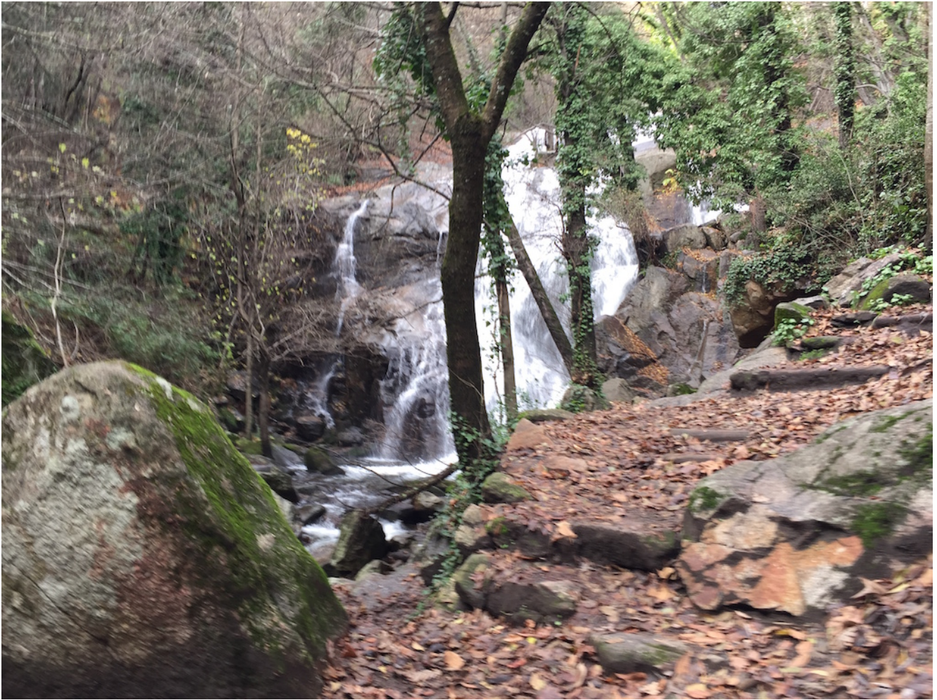
Garganta de las Nogaleas- Navaconcejo Nivel uno: 2,5 km y 100 metros de desnivel Nivel dos: 5,7 km y 318 metros de desnivel