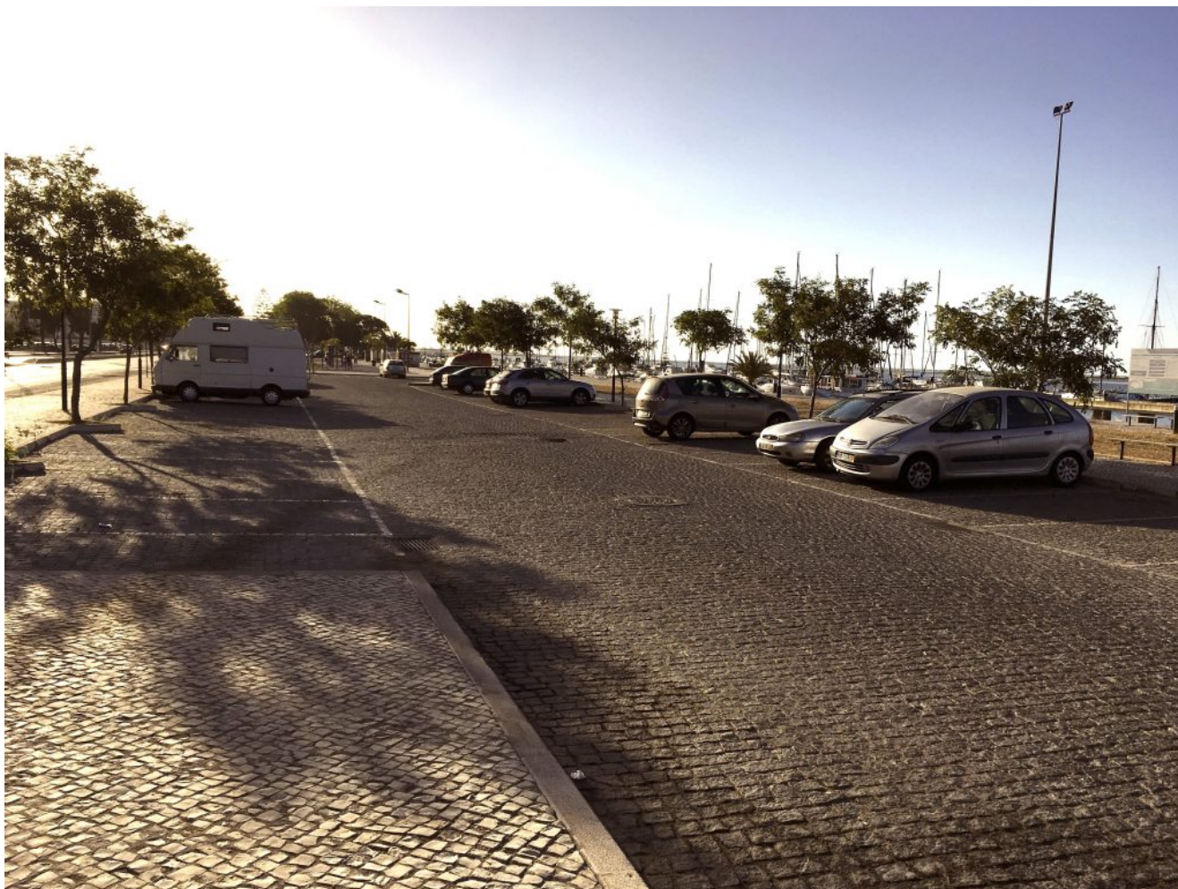
Lugar de estacionamiento Olhao

8.15 horas José Laguillo y a las 8.30 horas desde la Cervecería Ronda el Alamillo, y llegará a Olhao antes de las 11 horas (10 horas en Portugal). Nos dejará en la Avenida 5 de Outubro cuyas coordenadas son 37.023790, - 7.848307, (imagen 1) este es el lugar perfecto para dejar el vehículo los que vengáis en coche. Y 200 metros más adelante está el embarcadero cuyas coordenadas son 37.024058, -7.838013 (imagen 2), donde quedaremos para salir en el ferry de las 12 horas (11 horas hora portuguesa). Hay que ser puntual porque el ferry es cada dos horas y los billetes no se pueden comprar anticipadamente.