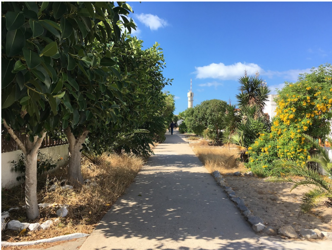
Localidad de Farol

sólo es perturbada su maravillosa tranquilidad por el constante paso de aviones que no sobrevuelan nuestras cabezas. Cuanto te vas de la isla una idea ronda la cabeza, ojala se estropee el barco para no tener que volver a casa.