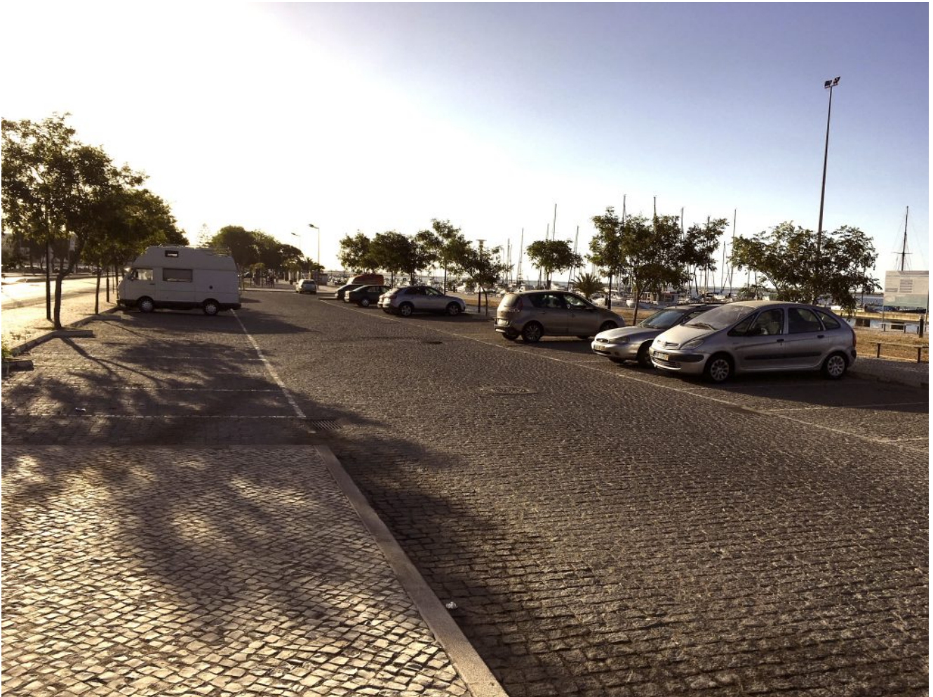
Lugar de estacionamiento Olhao

8.15 horas José Laguillo y a las 8.30 horas desde la Cervecería Ronda el Alamillo, y llegará a Olhao antes de las 11 horas (10 horas en Portugal). Nos dejará en la Avenida 5 de Outubro cuyas coordenadas son 37.023790, - 7.848307, (imagen 1) este es el lugar perfecto para dejar el vehículo los que vengáis en coche. Y 200 metros más adelante está el embarcadero cuyas coordenadas son 37.024058, -7.838013 (imagen 2), donde quedaremos para salir en el ferry de las 12 horas (11 horas hora portuguesa). Hay que ser puntual porque el ferry es cada dos horas y los billetes no se pueden comprar anticipadamente.